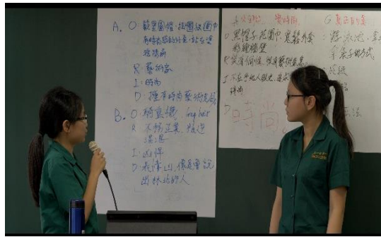
焦點討論法：全聯平面廣告分析報告