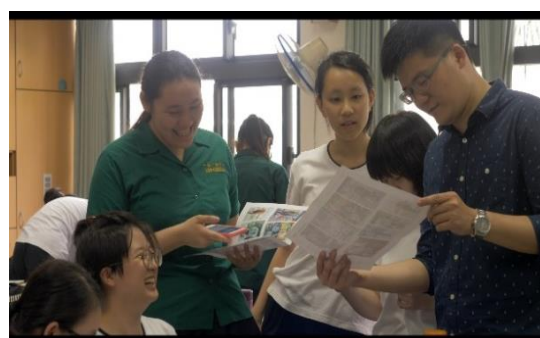
教師給予學生學習單回饋