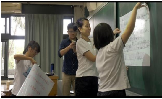
焦點討論法：小說文本分析報告