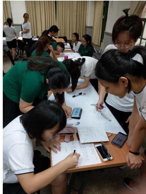
學生準備期末課程報告