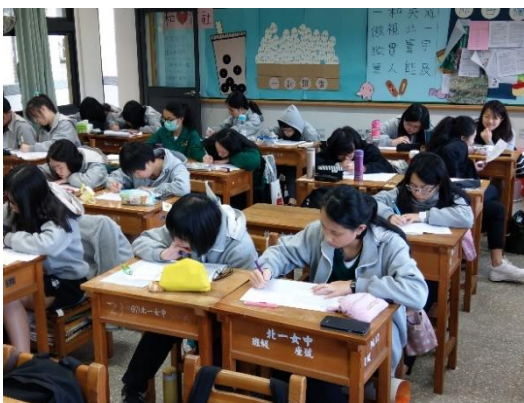
課堂完成影片轉譯文字學之習單