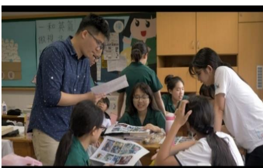
教師與學生之交流：焦點討論法