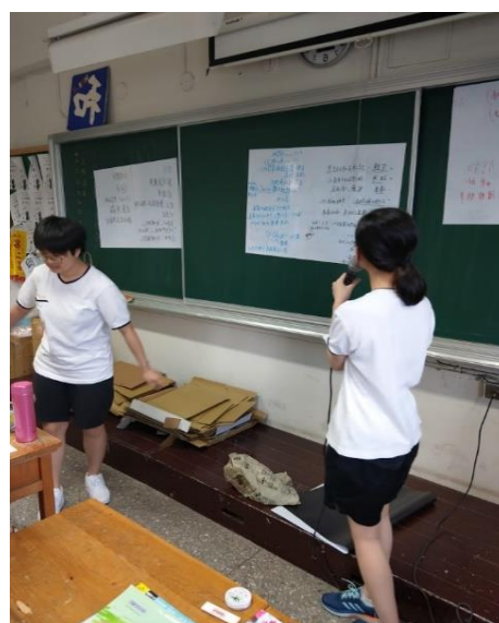
分組上台發表討論成果