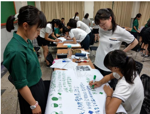
學生準備期末課程報告