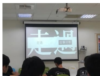
附中同學報告本學期討論巴代《走過》內容，左為故事分析、中為學生所抓取之關鍵詞、右為小說情節分析。

課程第二部分由同學報告自己在本學期的創作。以易智言電影《藍色大門》的影評影片作為開場，《藍色大門》因為以附中作為青春物語的背景，以致成為多數本學期創作同學的主題與動機，誠如報告同學改作自余光中〈等你，在雨中〉文句所言：「原本只是一所中學，最後變成了故鄉。」這些學生作品以現代詩為體裁，並多扣緊附中、青春等主題，在情感與技巧上或有「強說愁」的嫌疑，但文字大抵簡潔、明亮，誠如電影《藍色大門》對於青春的宗旨：夏天過去，似乎做了很多事，卻其實什麼事都沒做。只是學生作品在仿作余光中〈等你，在雨中〉的背景上，仍可見教師美學品好對學生創作的影響力。