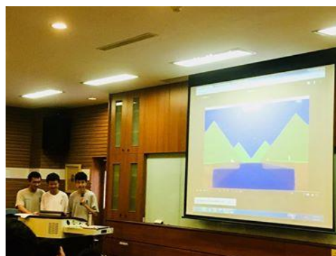
以《邊城》為背景的遊戲設計

軸，包括人與人之間的情感，以及場景的描寫，前者因為小說的人際網絡而分成祖孫、兄弟、情人三個脈絡。此外，小說推薦的對象不僅限於台灣島內，還向海外的日本進行推廣。第十四組，除了簡介小說內容，亦開創粉絲專頁介紹小說的內容、背景、角色人物族群背景、景物分析、繪圖。第十五組「Bang 緣人」則分享了說書、邀請名人分享、有獎心得徵稿，值得注意的是，本組透過程式的撰寫邊城遊戲，並將下載連結放在臉書粉專上發表，此外，藉由粉專的介紹讓尚未閱讀小說的讀者得以藉由文字了解小說的介紹。