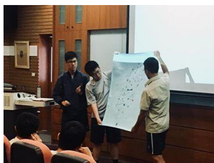
同學進行桌遊設計分享

第六至九組則以李屏瑤的《向光植物》為閱讀作品。以臉書作為專頁，第六組首先透過動漫圖片發表小說劇情簡介，以及細部劇情介紹、人物互動關係，並節錄小說內容、宣傳影片。此外，第六組提到以中山女高女學生的愛情為主軸，讀者將個人情感融入小說之中，藉此「體驗」中山女高學妹「愛著學姊」的感受。第七組引用小說中「我還不確定我喜不喜歡女生，但我覺得我喜歡妳」為開頭，提到作品以中山女高為背景，那麼推廣對象則設定為中山女高學生，小組預期目標為增加學生對同性戀議題的關注度，並透過人際網絡向中山女高同學推薦書籍閱讀。此外，小組在報告過程中亦分析「讚數」高低，以及在臉書之外的傳播平台：IG，其提到 IG 的點閱率高於臉書專頁，所以除了臉書專頁以外，同步開啟了 IG 專頁。第八組「一百道等待跨越的界線」，臉書專頁發文約十篇，透過分節進行小說導讀，藉此吸引讀者閱讀。原本設定同樣以中山女高學生為宣傳對象，但活動到最後沒有實際執行。第九組原本期望透過影片與作者進行訪談，但在最後因為內部協調問題，以致成果與預期有所落差，然而本組提出作品與其他作品的相關連結，其中包括易智言劇情片《藍色大門》，以及具時代感的手機。