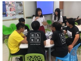
苗栗高中人社同學與復興中學師生（左一圖）、附中科學班同學（中、右圖）分組進行桌遊。