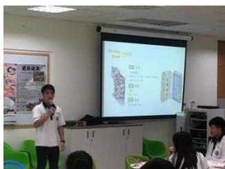
苗栗高中人社同學報告桌遊創作契機與背景。