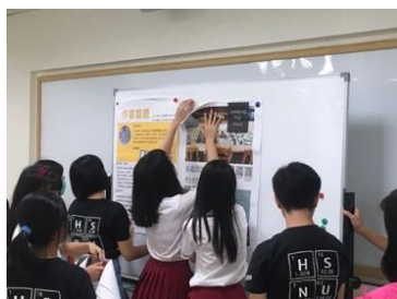
課程開始前，附中科學班學生協助苗栗高中人社班同學進行桌遊成果海報佈置。

課程一開始，由黃麗禎老師透過迅速瀏覽的方式，爬梳複習本學期附中科學班的課程內容。以巴代作品《走過》作為討論對象，本學期課堂討論主題包括小說的敘事觀點、語言功能、作品人物的自由意志與抉擇，以及相關史料，甚至是學術網站與論文在與小說的交叉對照後的可信度，還有作者如何談論自己的作品。