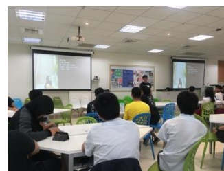
附中科學班同學報告個人創作。

課程第二部分由同學報告自己在本學期的創作。以易智言電影《藍色大門》的影評影片作為開場，《藍色大門》因為以附中作為青春物語的背景，以致成為多數本學期創作同學的主題與動機，誠如報告同學改作自余光中〈等你，在雨中〉文句所言：「原本只是一所中學，最後變成了故鄉。」這些學生作品以現代詩為體裁，並多扣緊附中、青春等主題，在情感與技巧上或有「強說愁」的嫌疑，但文字大抵簡潔、明亮，誠如電影《藍色大門》對於青春的宗旨：夏天過去，似乎做了很多事，卻其實什麼事都沒做。只是學生作品在仿作余光中〈等你，在雨中〉的背景上，仍可見教師美學品好對學生創作的影響力。