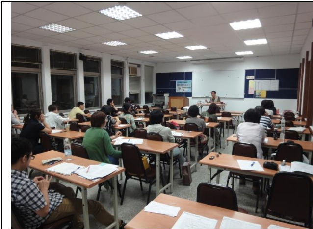
1. 劇本創作進階班的上課情形。