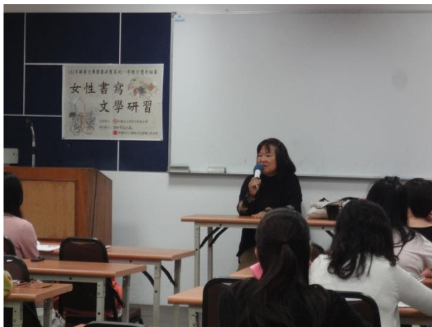
3. 愛亞老師帶著豐富的人生閱歷與同學分享寫作經驗。