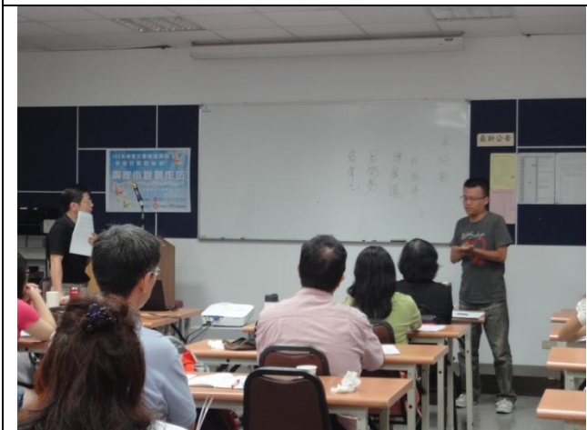
5. 學員上台發表對小說的看法，並與其他學員討論。