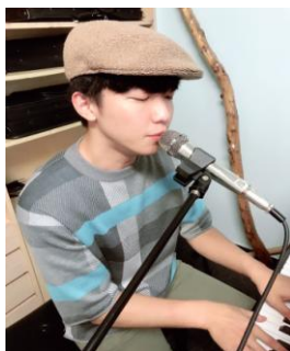
許蒙/作詞作曲（結清孤單、無關緊要、剪影、午夜、工人大合唱）

於 2006 年榮獲新聞局舉辦第十七屆【金曲獎】-『傳統暨藝術音樂作品類-最佳作曲人獎』殊榮，2007 年再度以「水鬼城隍爺-艋舺過水霞海城隍-數位音樂劇場-五幕舞劇（2006）」入圍第十八屆【金曲獎】-『傳統暨藝術音樂作品類-最佳專輯製作人獎』，2013 與財團法人中央廣播電臺合作的「幸福進行曲」拿下第 48 屆廣播金鐘獎。自幼學習鋼琴，由賴秋鏡老師啟蒙；十七歲時由林進祐教授啟蒙理論與作曲課程。隨後進入國立臺灣師範大學音樂系，先後隨曾興魁、陳茂萱及陳樹熙教授學習。1993 年負笈美國麻州波士頓大學（Boston University）繼續攻讀作曲及音樂理論，隨美國即興音樂創作前鋒， 佛斯（Lukas Foss, b. 1922 —2009） 、希臘現代音樂之父， 安東尼奧（Theodore Antoniou, b. 1935 — ） 以及波士頓大學音樂系作曲組主任， 瑪利曼（Majorie Merryman, b. 1951 — ） 等大師學習，於 1999 年 1 月取得音樂藝術博士學位（DMA），2013 獲選為美國波士頓大學維基百科網站(BU WIKI)唯一臺灣知名校友(Notable Alumni)。現為國立臺灣師範大學音樂系終身免評鑑專任教授。兼任於國立師大附中音樂班。專長領域：作曲、數位創作藝術、電腦音樂與音樂理論，亦積極參與結合影像互動的數位跨領域藝術創作。創作涵蓋各類型古典獨唱(奏)、室內樂、管絃樂、舞劇及音樂劇場。近年更在音樂劇、流行音樂與商業配樂有大量作品出產，成為國內跨界音樂創作的重要作曲家之一。