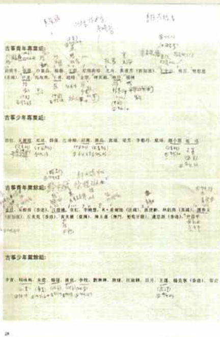
▲ 1989ART杯中國樂器國際比賽秩序冊，古箏組參賽名單，包含筆者當時的筆記（部分選手的自選曲目、名次與分數）