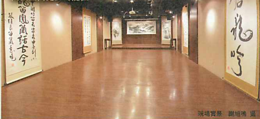
現場實景

琴園藝文空間的設立，不但樂團擁有專屬的排練空間和錄音間；多年來不定期藝文沙龍的活動、跨界結合的演出，在此空間場域聚集的文化人、傳統音樂愛好者及年輕學子們為琴園藝文展演空間激盪出更多可能性。