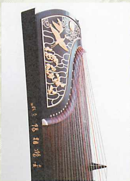
▲金鶴朝陽箏

為了紀念【雙鶴朝陽】箏銷售逾四十萬台，徐振高的弟子從數十件優秀作品中篩選出一台，再經反覆打磨加工，歷時一年多精製而成這台孤品【金鶴朝陽】箏，箏體採用「帝王之木」小葉紫檀，紋理纖細狀如牛毛，日久色澤逐漸深化為暗紅。雕飾秉持雙鶴朝陽圖飾之原作，由百年金店「老鳳祥」的師傅以18K金飾精心打造，作品「平嵌雲紋巧配浮雕，蒼勁挺拔的翠松之上，兩隻飄逸的飛鶴穿過輕拂繚繞的浮雲、奔向璀璨的朝陽，暗紅色的琴體覆以金黃色的圖飾，盡顯高貴優雅之神韻。」