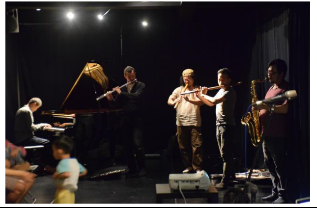
Space. Toccata 演出(管樂/長笛、簫、笛、薩克斯風)