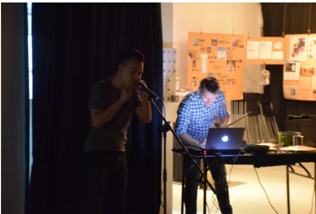
Space. Toccata 加入美國打擊樂家合作