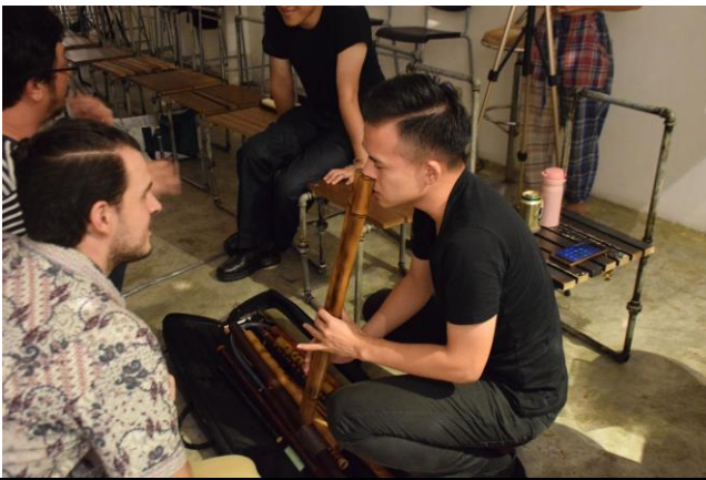
RAW ART SPACE 台灣鼻笛與西班牙長笛演奏家交流