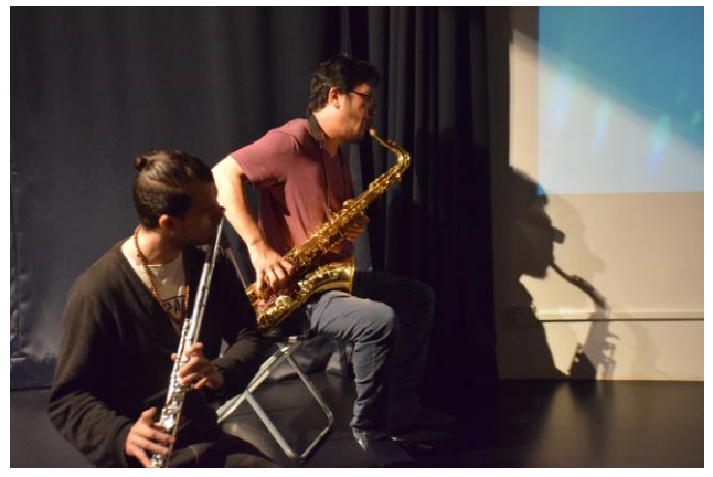
Space. Toccata 西班牙長笛演奏家加入演出