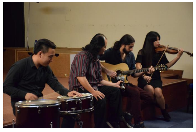
梳邦再也世紀學院 學生嘗試即興演出