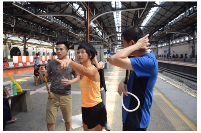
吉隆坡車站-討論行為發生地點