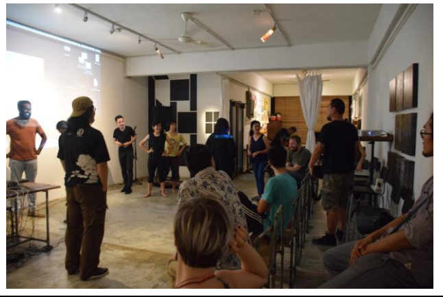
RAW ART SPACE 會後交流場景