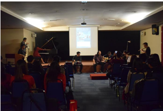
梳邦再也世紀學院 講座分享後的演出