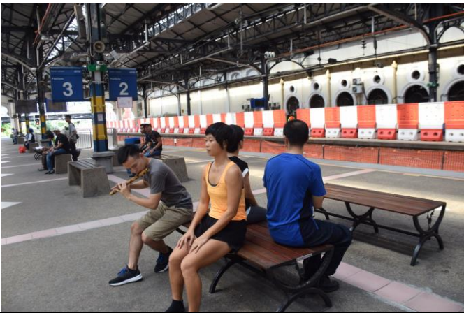
吉隆坡車站-即興行為演出