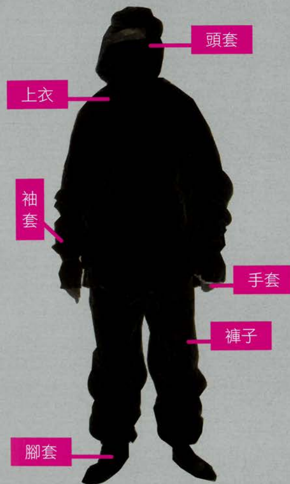
圖：技術演員（黑衣人）的全套配件

技術演員全身著黑色服裝（詳見下圖）。黑光劇最怕的就是“穿幫”或曝光，因此，技術演員（黑衣人）的服裝格外重要。基本上，技術演員是在全黑的舞台上都能發揮其作用，唯一要注意的是，整套黑衣要用黑色絨布製作，在黑燈下才不會因不同的色差而造成曝光。