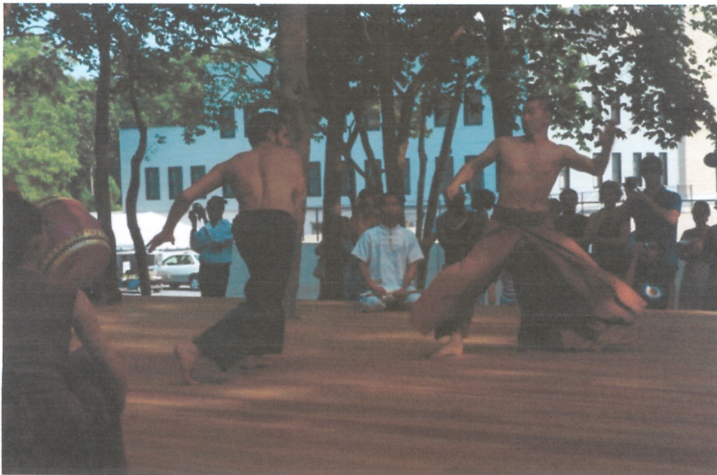
開放日與法籍藝術家演出《沖岩》