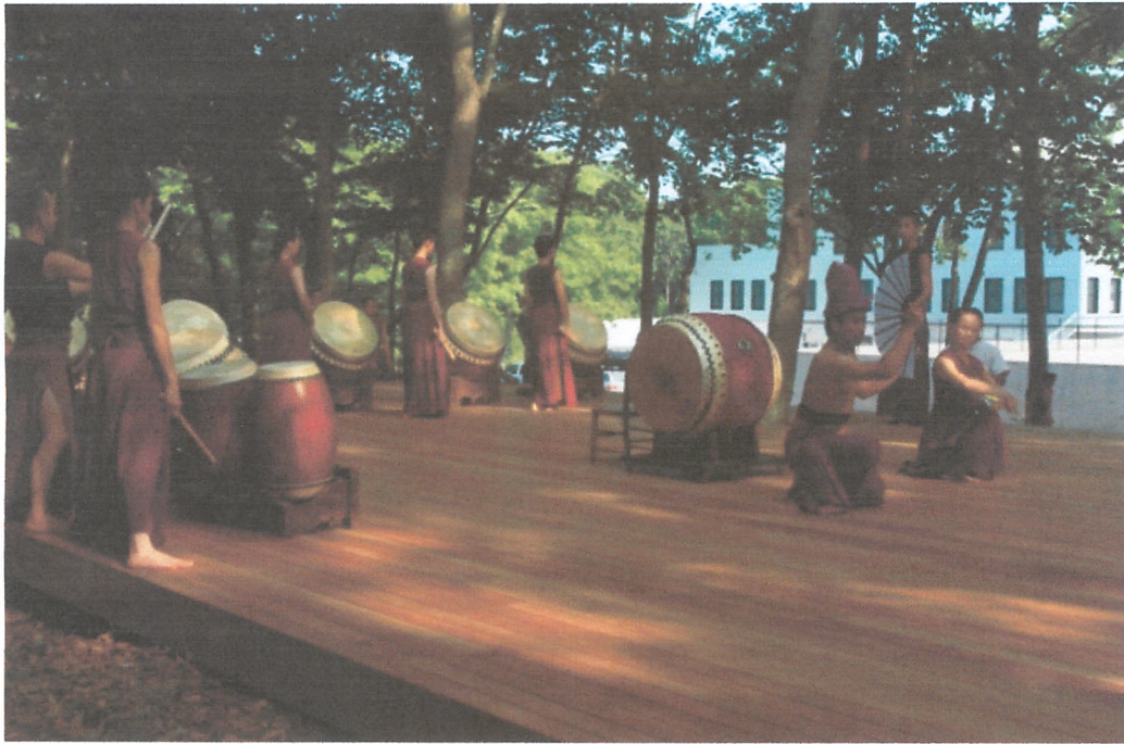
開放日與印尼籍藝術家演出《金剛王寶劍》