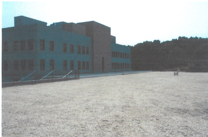
「水磨坊藝術中心」外觀