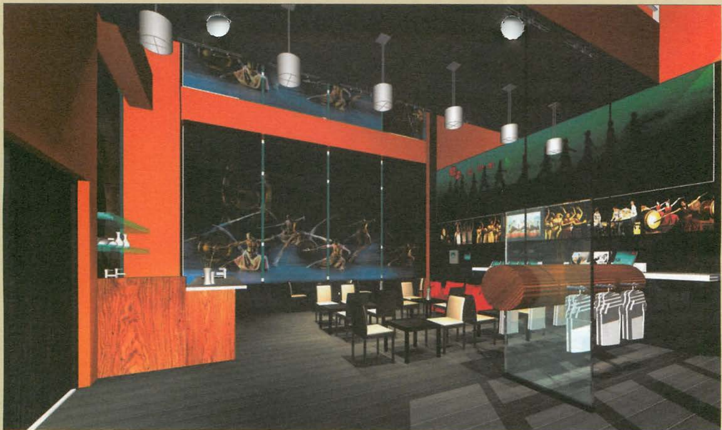
空間3D模擬示意圖 李顯台