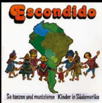
【4409】So tanzen und musizieren Kinder in Südamerika 南美兒童舞蹈與音樂