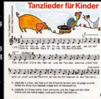
【4401】Tanzlieder für kinder 兒童舞蹈歌曲

舞蹈設計：涵蓋文藝復興、世界各國的兒童舞蹈、民族舞蹈、肢體律 與即興，適合各年齡層