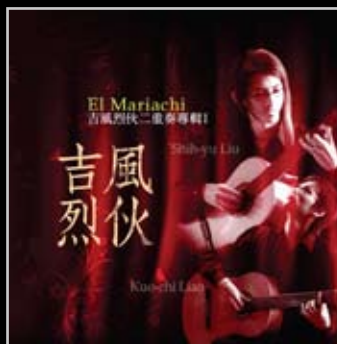
吉風烈伙 / 劉士堉、廖國志 吉他二重奏