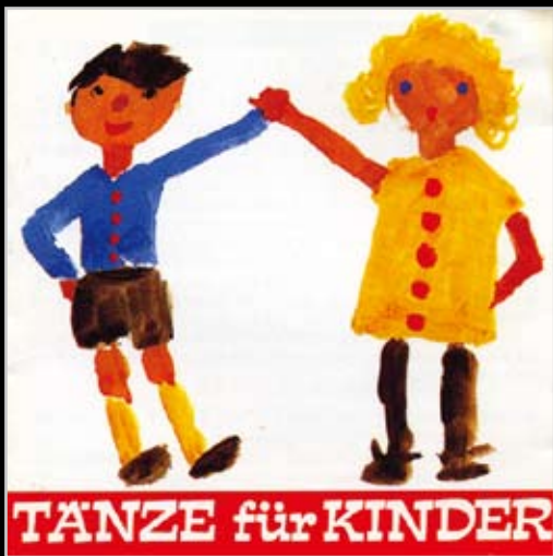
【4415】Tanze für kinder 兒童舞蹈嘉年華

飛 杜拉出版公司(Fidula-Verlag)已有50年以上的歷史，是德、奧出版舞蹈音樂極為著名的公司，其出版品涵蓋文藝復興的舞蹈音樂，世界各國的兒童舞蹈音樂、民族舞蹈音樂……等。此系列之音樂以多種樂器演奏，節奏明確、曲式清楚、活潑輕快、旋律 聽，是值得欣賞、適合各年齡層、可跳舞、可玩音樂遊戲及認識世界音樂的最佳音樂、舞蹈與遊戲的三合一教材。