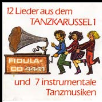
【4441】Lieder aus dem Tanzkarusell I 兒童歌舞狂歡