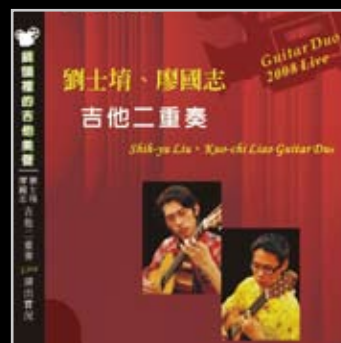
鏡頭裡的吉他美聲DVD