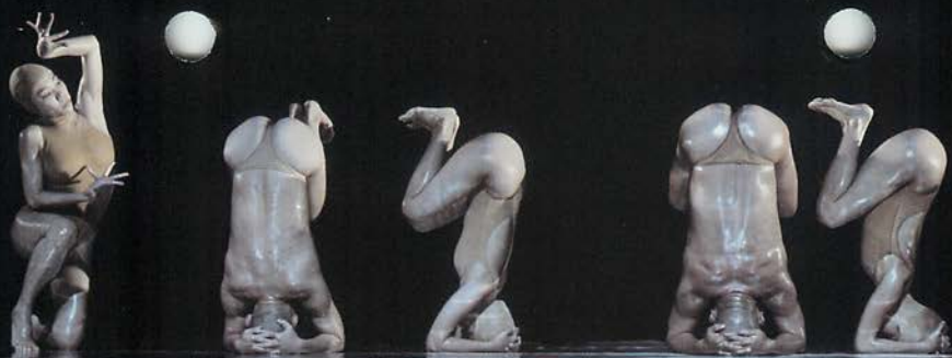
• 嬰兒油上的現代舞/1994《奧林匹克》