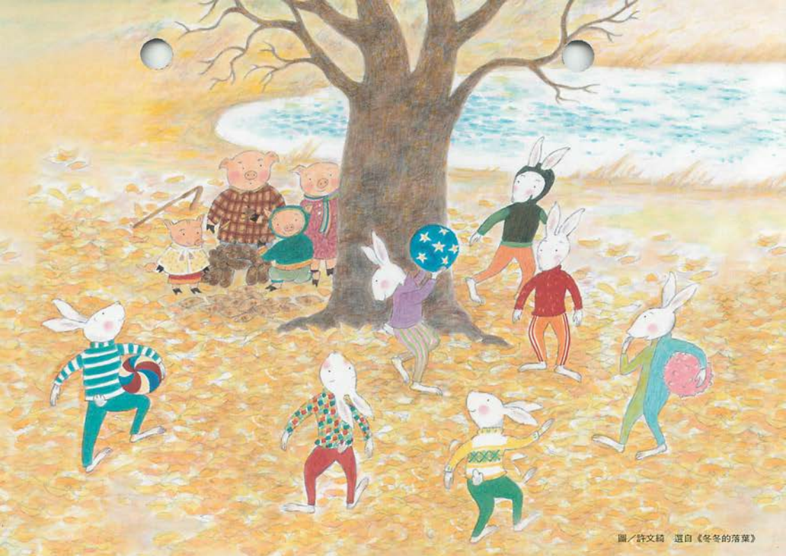
圖／許文綺 選自《冬冬的落葉》

人生，從愛智開始 Learning, let it begin with AICHI