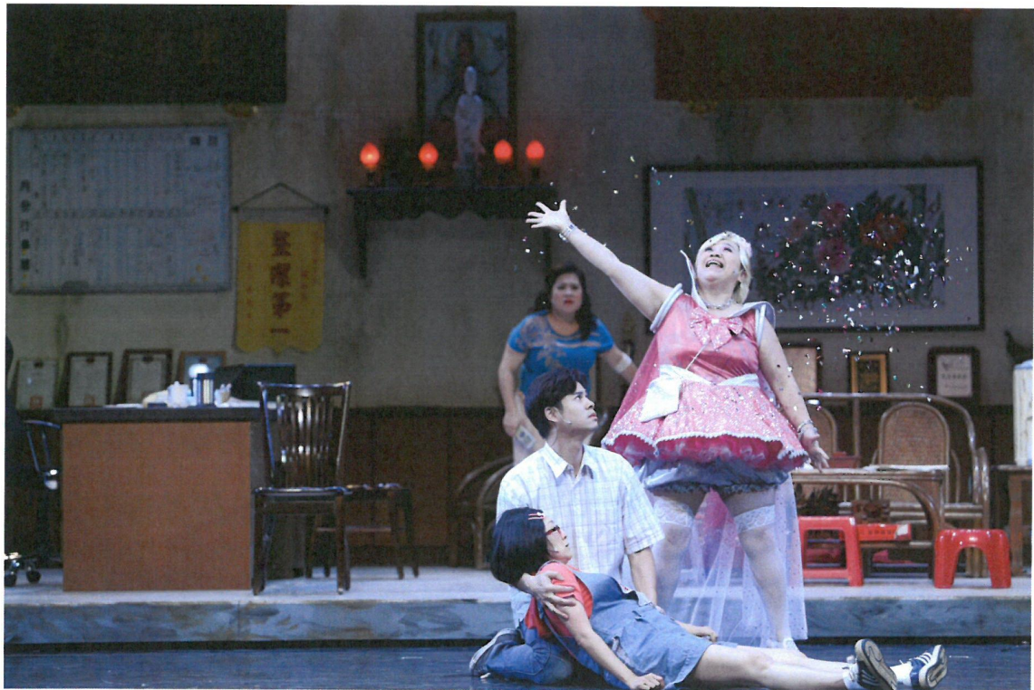
被阿嬤附身的阿美躺在小幹懷裡，西施在一旁製造氣氛