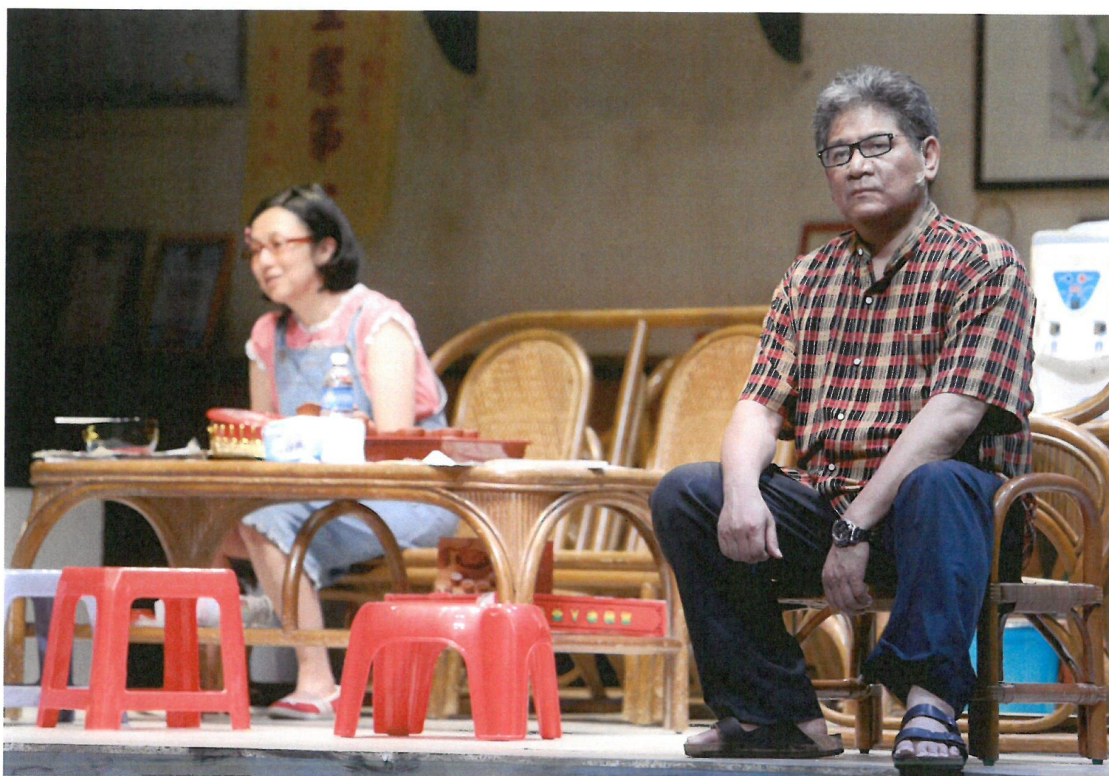
里長伯被抓回來，母女二人互吐心聲，化解多年來的誤會