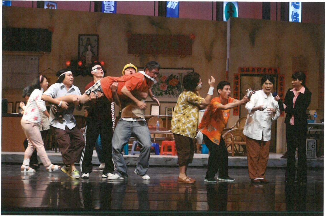
向媒體實話實說的仙姑，讓里長伯急著搶奪麥克風