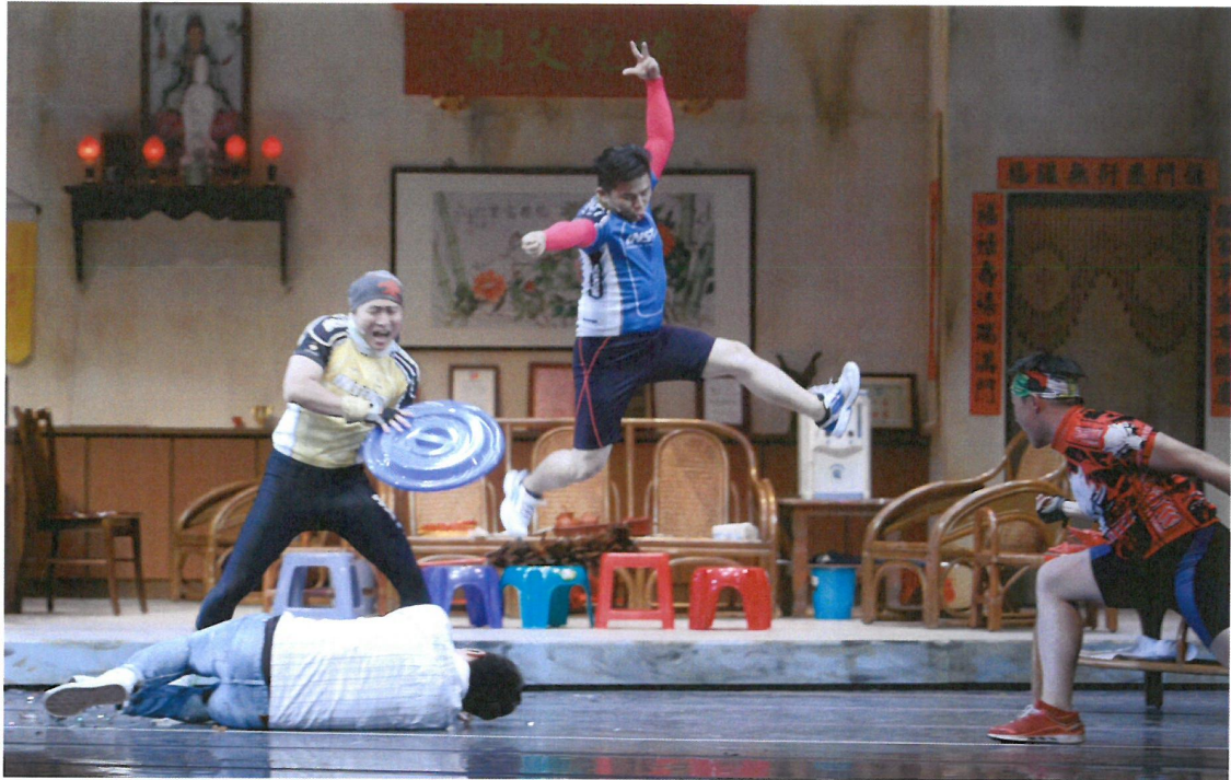
奧少年到里長伯家裡來鬧事，毆打小幹