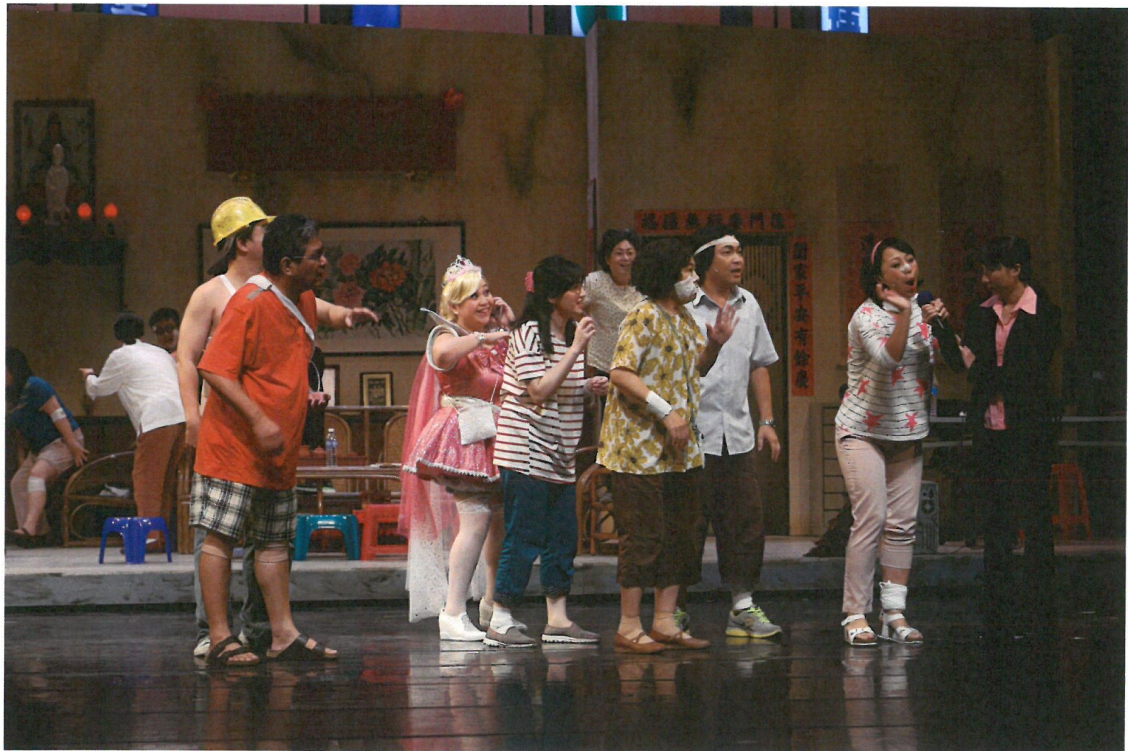
參加自強活動受傷的里民們，對媒體記者訴說實情