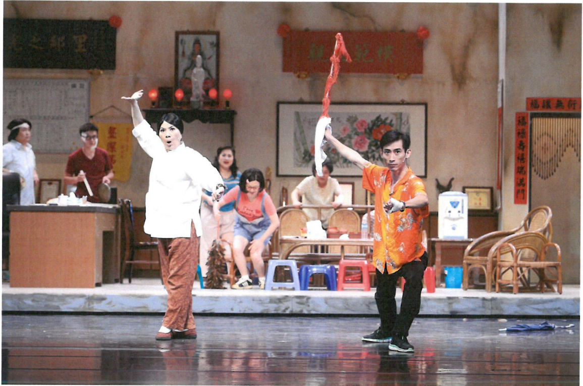
仙姑與椿腳唱作俱佳，來一段歌仔戲驅邪