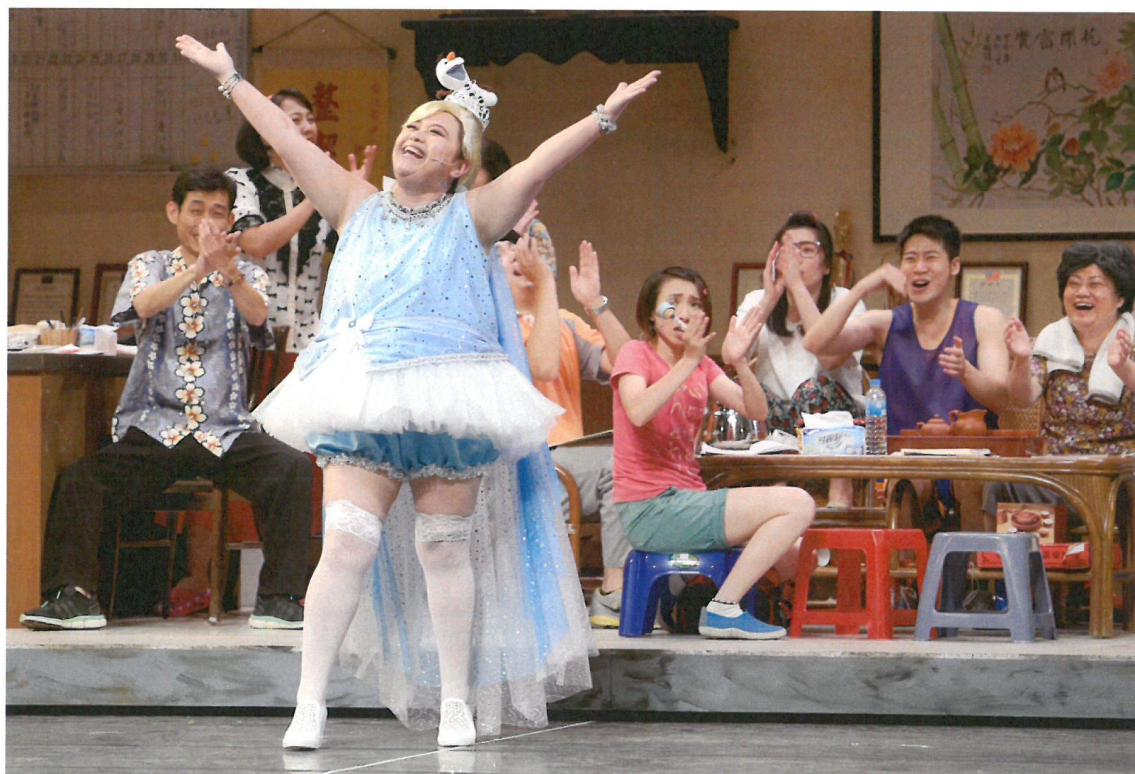
新興里的檳榔西施，里長伯對她非常頭疼