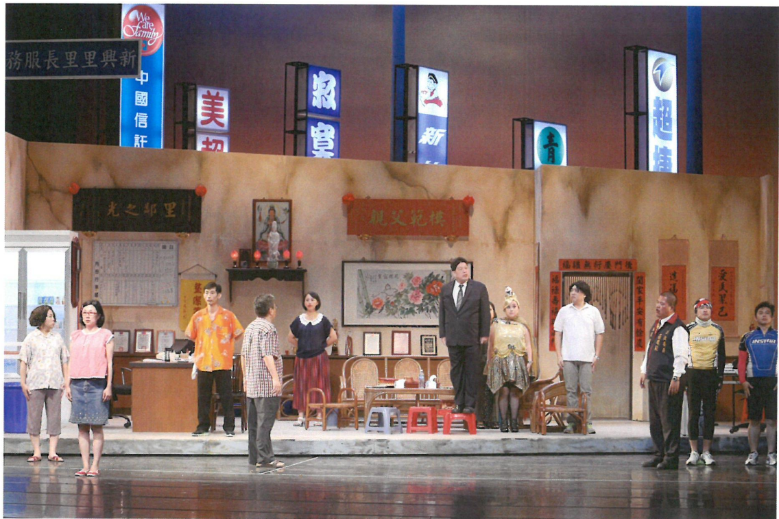
立委助理偕同校長一起到里長伯家裡，為被阿美施暴的奧少年討公道