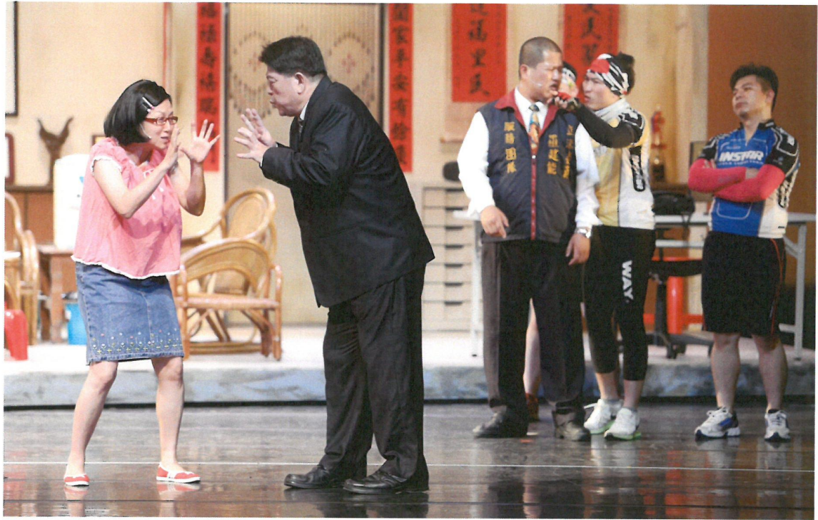
校長一直對被阿嬤附身的阿美辯解自己學生時期的糗事