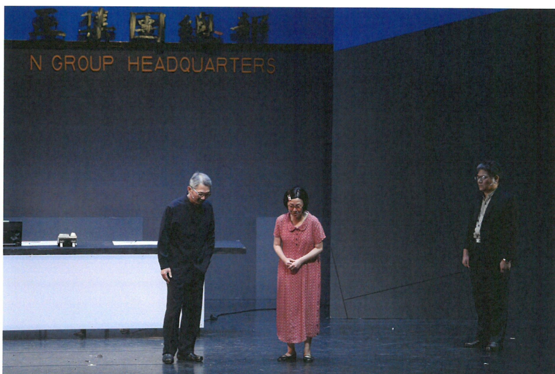
阿嬤終於見到昔日恩人，希望對方千萬要保重、千萬要平安