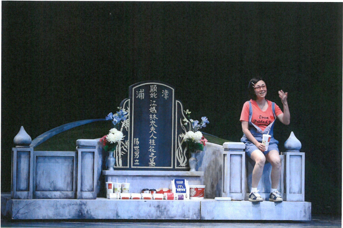
清明節放假，阿美到阿嬤墳前掃墓，傾訴自己心情