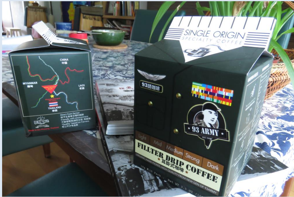
93師咖啡 禮盒封面繪有片中泰北沈慶復之父親 沈加恩肖像及泰北簡史及地圖