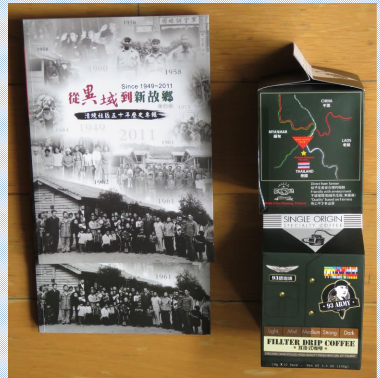
清境50年圖文集， 為清境滇緬游擊隊之口述歷史及圖片