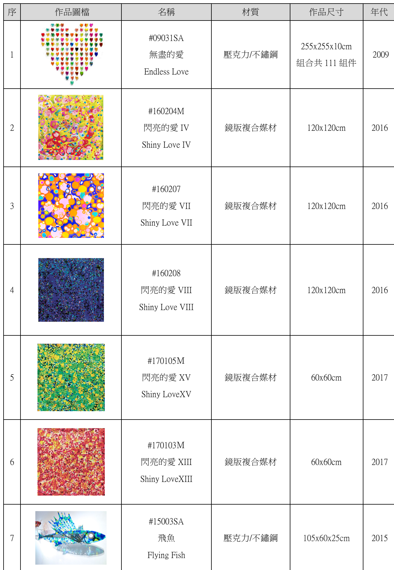
實際展出作品明細表