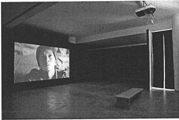
Installation view, REDCAT, Los Angeles.

REDCAT 藝術中心屬於 REDCAT—洛伊和埃德娜迪士尼/加州藝術劇院 (Roy and Edna Disney/CalArts Theatre (REDCAT))。洛伊和埃德娜迪士尼/加州藝術劇院擁有在洛杉磯地區擁有獨特的權威性：它為各類前衛作品和藝術觀念開闢出一個實驗場域，並展現不同的形式和文化。該劇院及音樂廳由著名建築師 Frank Gehry 設計，外觀用不鏽鋼版鑄造，是洛杉磯的重要地標。該劇院占地 30 萬平方米，主廳可容納 2265 人，西南角有占地 3 千平方英尺的 Roy and Edna Disney/CalArts Theatre (REDCAT) 劇院、小劇場以及藝廊。