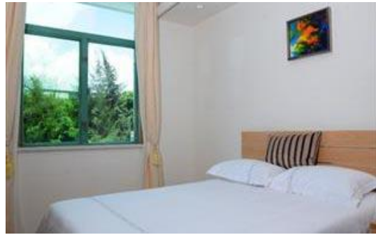
北京奧萊快捷酒店