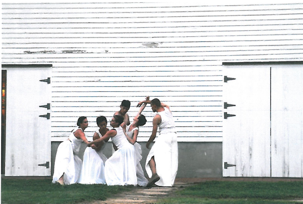
8/9 穀倉演出，〈來自穀倉的古老訊息—甦醒〉，音樂為和維吉尼亞州音樂家 Dale Paul Lazar 現場合作