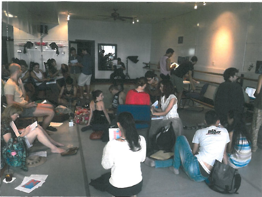
工作坊討論場景，地點：Palace 劇院排練室