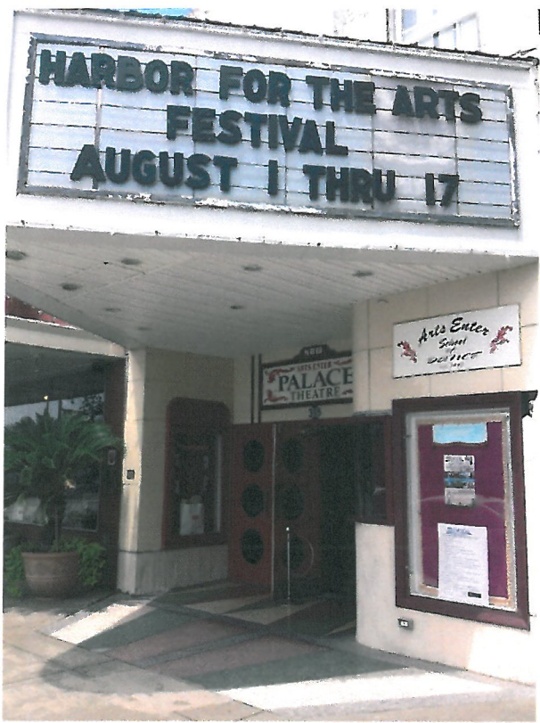
建立於 1941 年的 Palace 劇院，藝術季基地