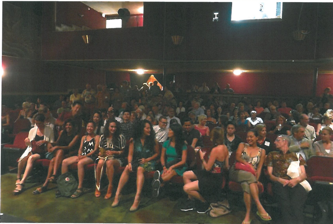
8/16 EFV 首映會，Palace 劇院座無虛席。前兩排為所有參與影像導演和舞者們