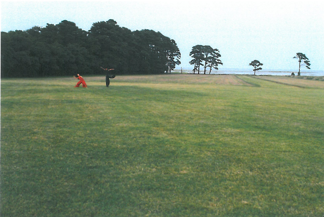
8/9 穀倉演出，〈來自風息〉，音樂為台灣客家歌手羅思容與孤毛頭樂團的〈山歌歌〉