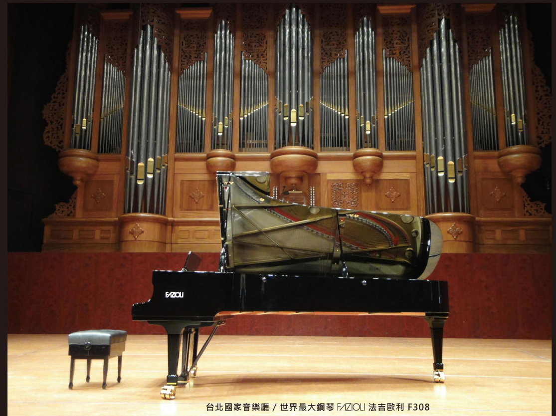
台北國家音樂廳 / 世界最大鋼琴 FAZIOLI 法吉歐利 F308