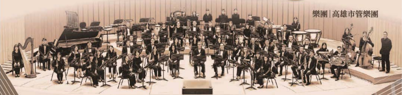
樂團 | 高雄市管樂團