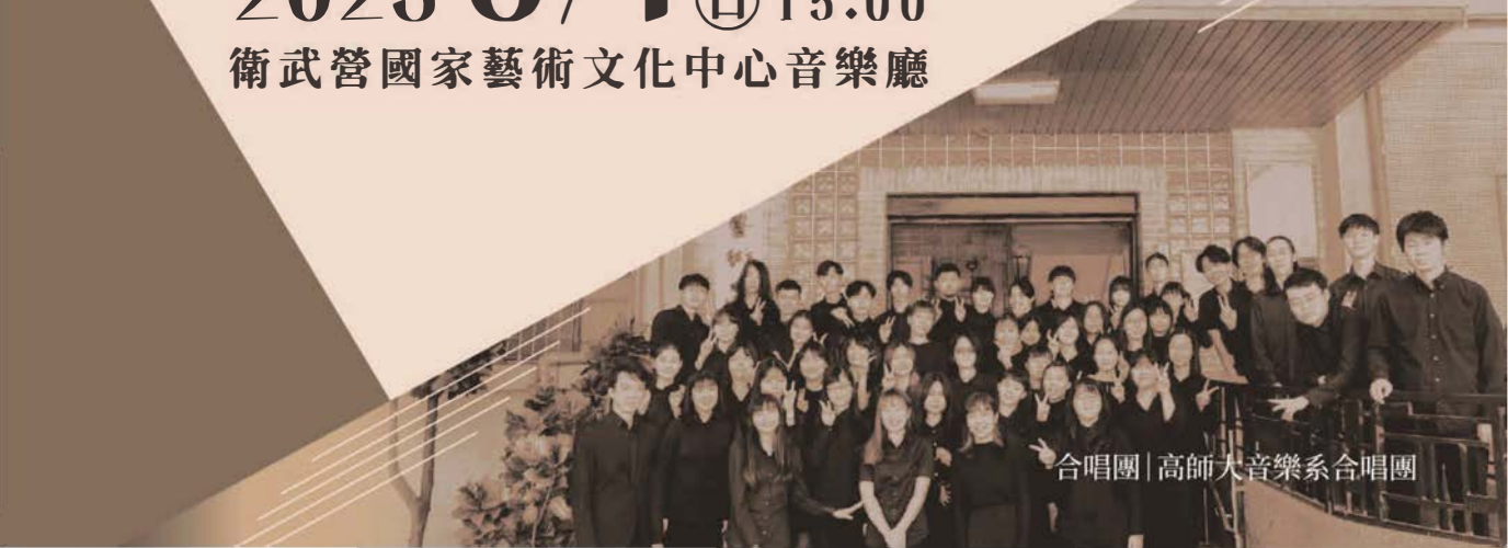
合唱團 | 高師大音樂系合唱團