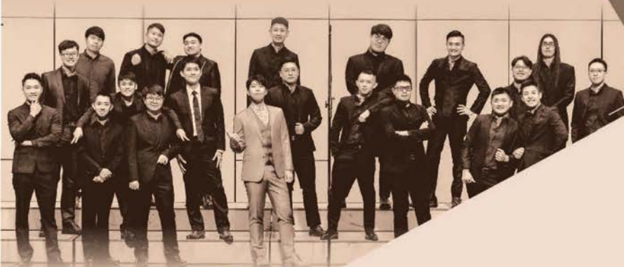
合唱團 | 微行星男聲合唱團