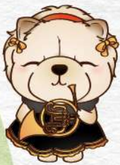
法國號 French Horn