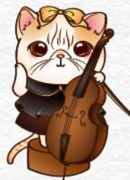
低音提琴 Double Bass