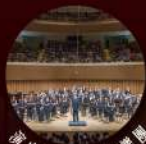
演出 | 高雄城市管樂團