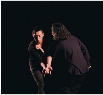
中國文化大學舞蹈研究所碩士畢業 古舞團團員

台南西拉雅族，中國文化大學舞蹈研究所碩士、中國文化大學舞蹈學系畢業，現為「古名伸舞團」團員，即興舞蹈、接觸即興推廣教師、「三十舞蹈劇場接觸即興」課程指導，近年積極以即興舞蹈與接觸即興之形式，融匯於當代舞蹈創作及肢體開發。專業授課於國高中舞蹈藝才班外，同時於古舞團台東即興工作坊、北京七七藝術生活節、坊間舞蹈團進行現代舞、即興舞蹈、接觸即興教學。