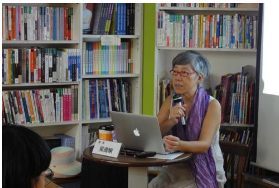
8/19 瑪俐老師列舉當代重要女性藝術家的故事，看她們如何透過地景藝術、社區藝術，做出有別於男性藝術家的戰爭作品，走向心靈療癒，洗滌災難的悲痛。