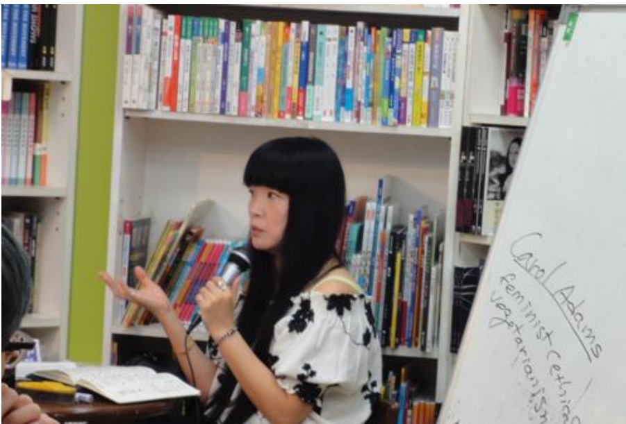
8/12 在台灣較難找到素食女性主義的相關研究，君攻老師替大家補充新知。