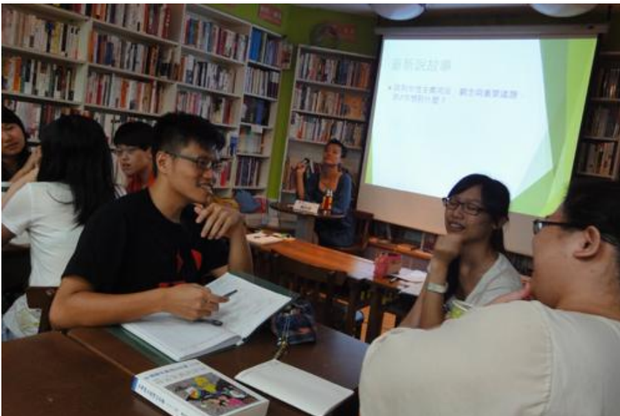
7/24 透過討論可以激發學員的腦力與想像力。