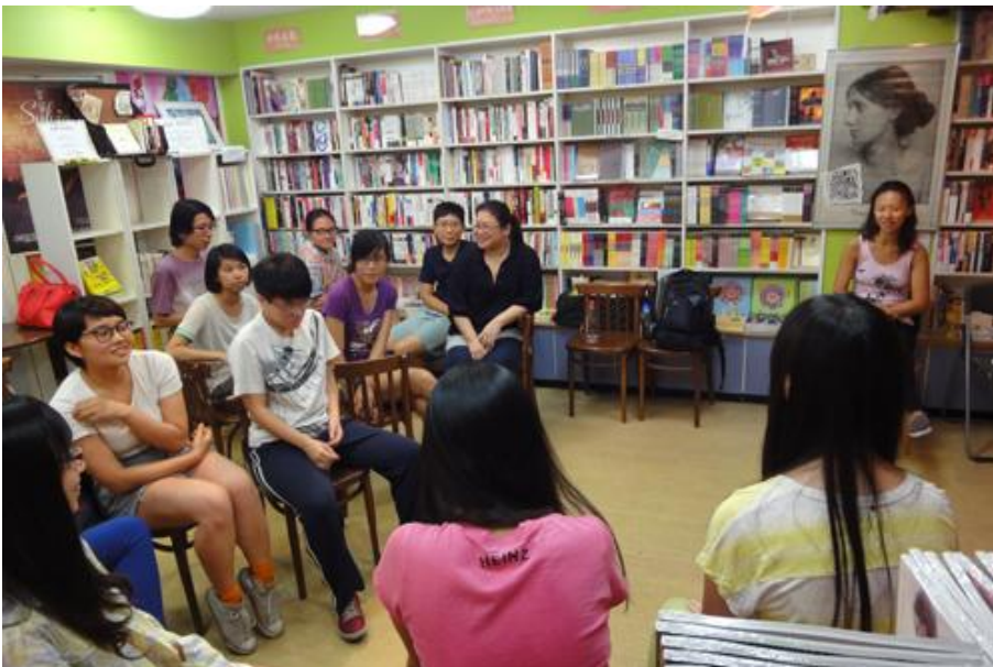
7/17 工作坊最終的成果呈現，小組以接力方式共同演出一個性／別汗名的故事。