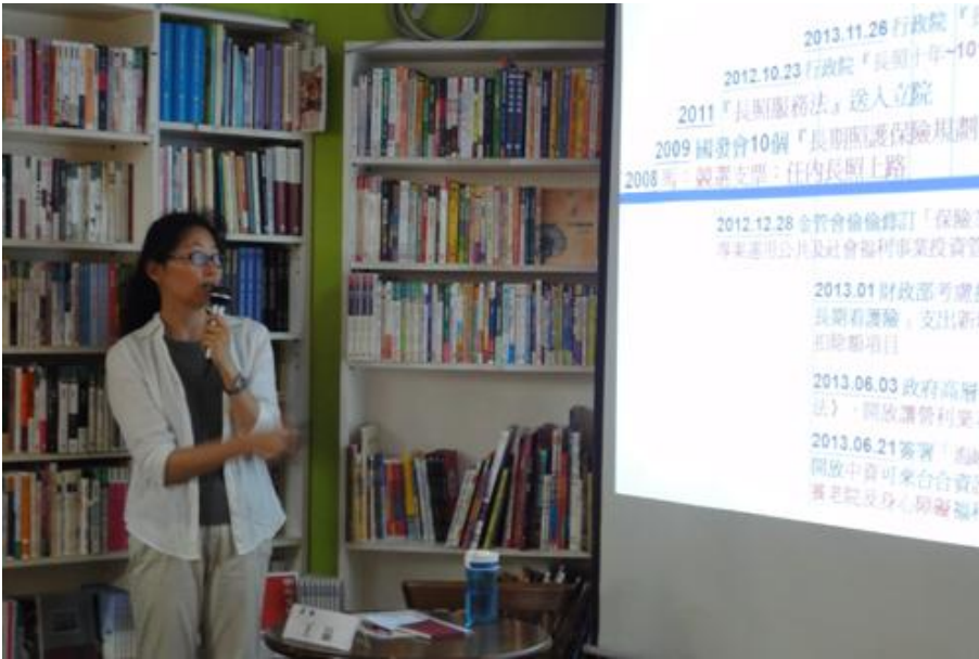
7/15 王品老師長年蒐集長期照顧相關數據及資料，PTT 內容非常豐富紮實。