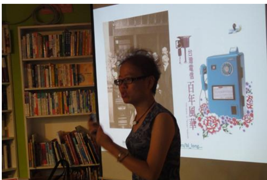
8/5 透過科技結合性別的設計圖像，讓學員理解在科技生活中納入性別觀點的重要性。