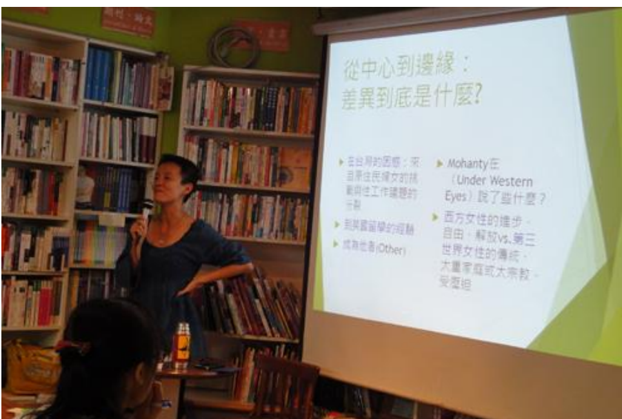
7/24 佳羚老師從自身到瑞典求學受到的種族歧視出發，直指歐美白人女性主義的荒謬所在。