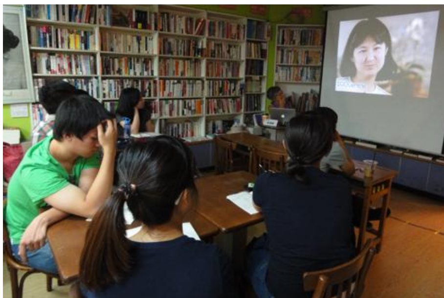
8/19 欣賞藝術家訪談的影片，更可以理解作品本身涵蓋的精神。