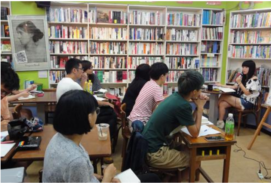
8/12 生態倫理一直是女性主義關心的議題，君攻老師大量引用人類學、生物科技研究等例子，讓學員直呼：老師學問好淵博啊！