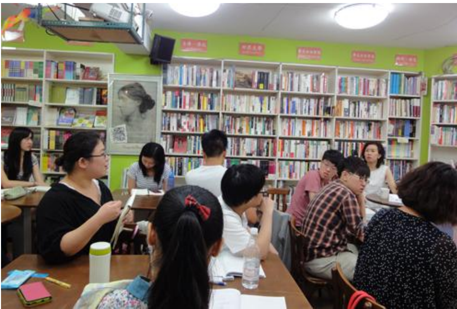
7/22 學員對於老師質性的研究方法很感興趣，老師也不吝給予訪談技巧的指導 7。