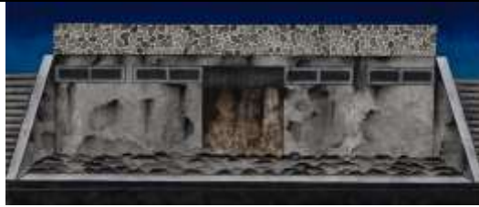
屋顏 2014 30x70cm 畫布.絹.水墨.膠彩

坐落在川流不息的城市角落，是個倏忽即逝的風景，不被注視的視覺死角，卻依舊持續著，安靜的紀錄著時間，彷彿時空的任意之門隱藏在此，是一個缺口，默默的交換、紀錄不同的時間序。