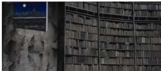
有月亮的晚上 2014 30x70cm 畫布.絹.水墨.膠彩

首次嘗試描寫室內空間，選取改建老建築成的場景，藉由擺設新、舊物件的穿插，好像劃開時空的動線，使得兩個平行時空得以並存，刻意選用跟以往創作的慣用色調，暖色系的呈現時間與人的共存，是個新的嘗試。