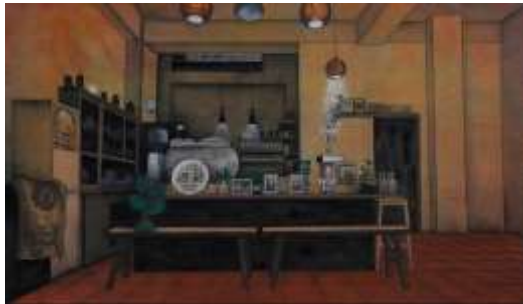
暖暖 2013 70x120cm 畫布.絹.水墨.膠彩

以長頸鹿做為個體的象徵，表現城市中的人大多非原生於此地，而是外流入討生活的表徵，長頸鹿形象優雅且鮮明，也是一般大眾接受度高的動物，穿插於巨型建物中明顯且和諧，試圖傳達城市讓人迷失卻也難以逃離的曖昧情感。