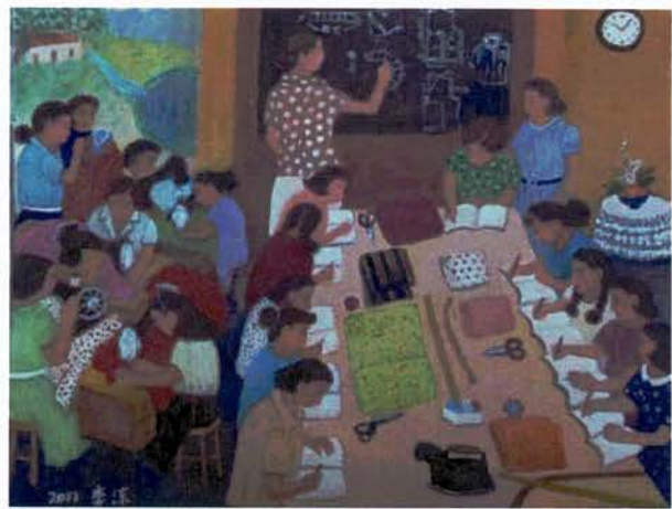
作品名稱：裁縫教室（暫名），2011。油彩。

作品說明：李涼曾帶著家人到琉球旅遊，留下深刻印象。這件作品獲得 2000 年朱銘長青藝術創作比賽「大師獎」，讓她獲得很大的鼓勵。