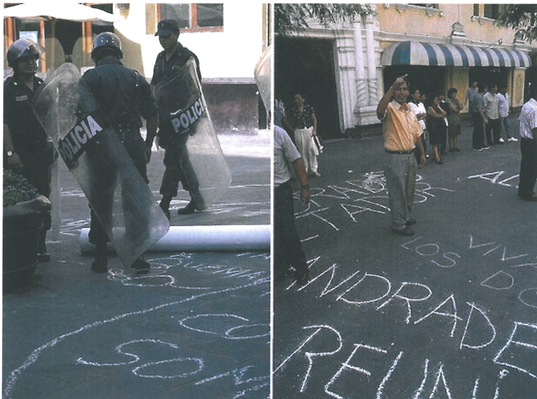
Jennifer Allora and Guillermo Calzadilla, TIZA, 1998–2002