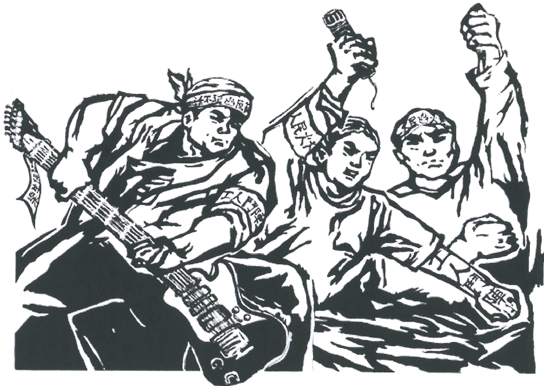
黑手那卡西《怎麼辦？》演唱會海報，胡清雅繪，2007