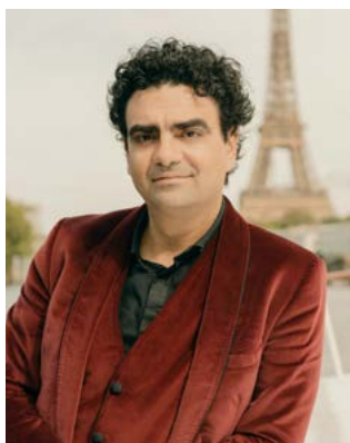
羅蘭多·費亞松 ROLANDO VILLAZÓN / 男高音

被譽為世界十大男高音之一，出生於墨西哥市，集合音樂家、導演、小說家、藝術總監及廣播、電視訪賓等多重身分，是當今全球頂尖的藝術家。1999 年贏得「多明哥國際歌劇大賽」查瑞拉歌劇獎與觀眾獎，以獨特的演繹征服世界各地最重要的舞台，確立樂壇巨星地位。《泰晤士報》稱頌他是「當今最迷人的男高音天王」；《南德意志報》則盛讚他「擁有最雄偉的歌聲——大器磅礴，優雅又充滿力量」。執導次女高音巴托莉領銜的《塞爾維亞理髮師》，獲得國際樂壇廣泛好評。2022/23 樂季，費亞松與導演切尼亞科夫、指揮蒂耶曼合作華格納《指環》，詮釋《萊茵的黃金》中火神洛哥一角。與指揮畢凱特合作蒙台威爾第的《奧菲歐》。費亞松更是 2023 年的薩爾茲堡莫札特週策展人，屆時將與維也納愛樂共同演出莫札特《安魂曲》。