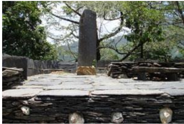
頭目家前的前庭及司令台，是集合部落族人公布事情及討論的地方

排灣頭目家屋最明顯的便是寬廣的前庭和司令台，均由石板鋪成，司令台上有頭目標石和大榕樹，司令台通常高約 1 公尺，由石板砌成，寬約 4 至 6 公尺，前庭四周有用石板疊砌之石垣，是作來為防禦用的，亦可界定前庭等之邊緣。