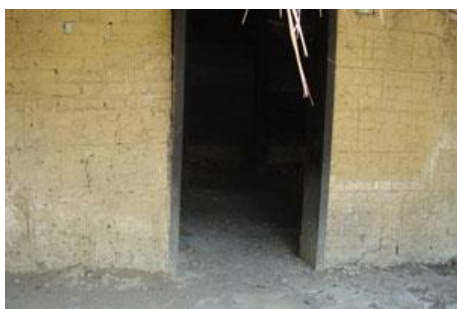
牡丹社建築利用土塊砌成