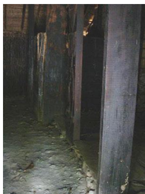
太麻里社建築，屋內左右兩側均為寢台