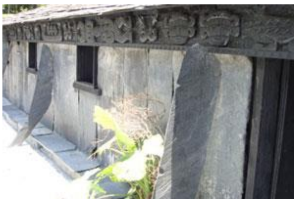
頭目家才享有雕刻權利

石板屋的雛形早在古時候韃噶拉鳴絲時已形成，建築結構及設計都非常簡單，以石片一層層地堆成牆壁，以木材成橫樑，屋頂以樹皮及蘆葦蓋成，地上鋪石板。到了巴達燕時，已經進步到全部使用石板，並開始雕刻中心柱，如石板屋的牆上有百步蛇的圖騰，那就表示這是頭目的家。因為傳說排灣族排灣村的祖先是百步蛇，所以頭目家的牆上都有百步蛇的圖騰。這中間的演變過程，稱為石板文化。排灣族人以石板屋為一種藝術，是一種力量和智慧的偉大表現，而排灣族人一生中以擁有一棟石板屋為最大榮耀和光彩（關華山，1982）。