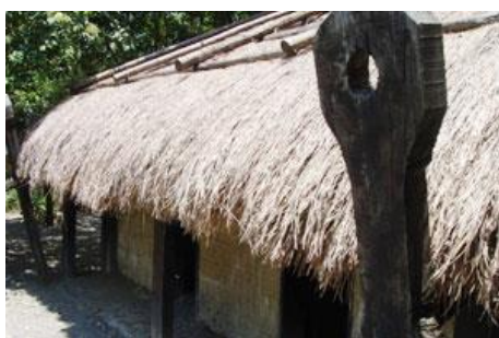
牡丹社 2 門平地式實地建築