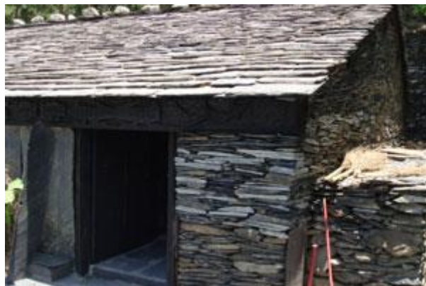
佳平社的傳統建築

北部型是排灣族房屋建築的主要類型。包括原高雄縣旗山附近及屏東縣北部地區社群（三地門鄉、瑪家鄉及泰武鄉等地區）。北部型的建築最大特點就是大量使用石板建材。在此可以舉 1936 年日治時期（昭和 11 年）進行調查時所看到的佳平社的建築為例，來加以說明。