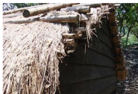
牡丹社建築為硬山式屋頂，茅葺頂，受漢人影響