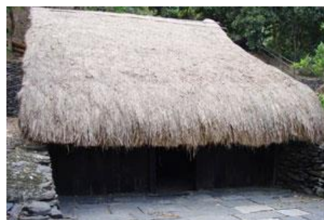
太麻里社頭目家屋