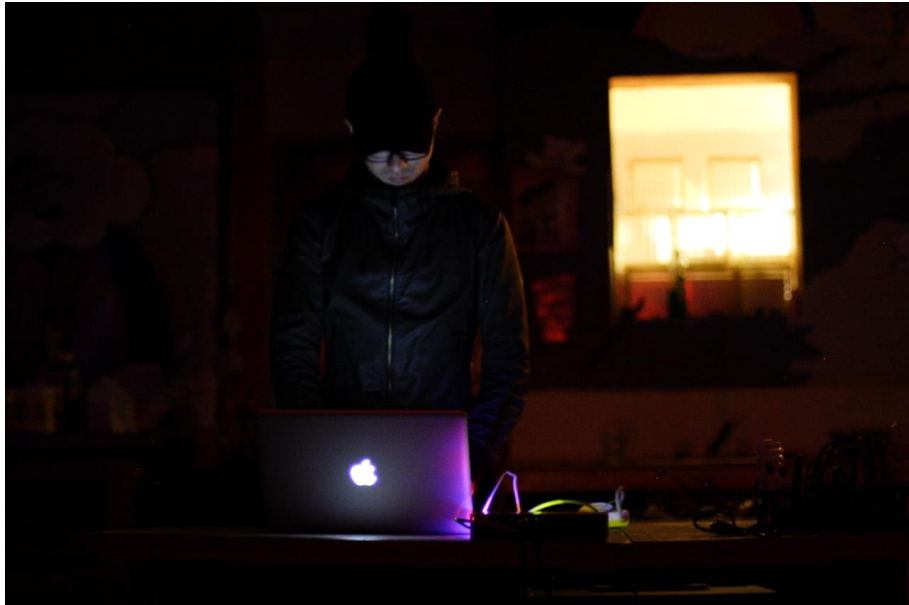
5/12 @ Silent Barn, Brooklyn NY