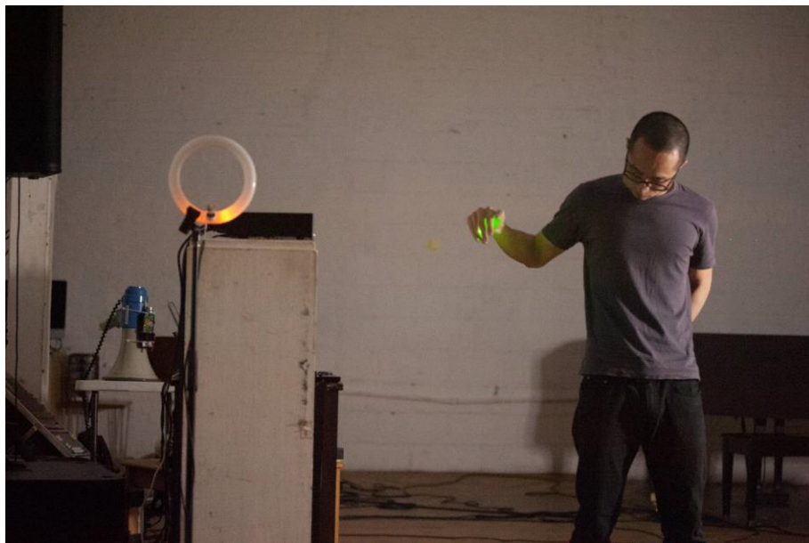
5/10 @ Issue Project Room, Brooklyn NY