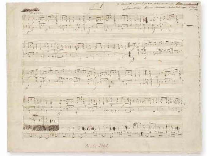
1810-1849, Mazurkas for piano, op. 50 : autograph manuscript, 1842? The Morgan Library & Museum

第一首，G 大調，甚快板 (Vivace)。曲式為 A-B-A-C-A 的輪旋曲，A 段每四小節的動機雖然重複非常多次，而顯得相當「洗腦」，但其實蕭邦在其中做了些和聲上的改變，讓每次的這個旋律動機長得都不盡相同。C 段為全曲除了 A 段主題以外的另一個特色，蕭邦大膽地使用了相當多的臨時升降記號，製造出