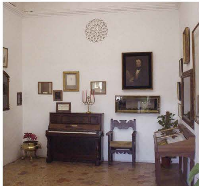
Chopin's Pleyel upright piano in the Valldemossa Charterhouse, Mallorca, where George Sand and he worked during winter 1838-1839