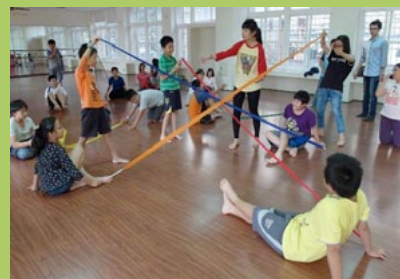
利用各種水平拉出漂亮的緞帶圖形