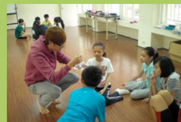
師生討論水的變化