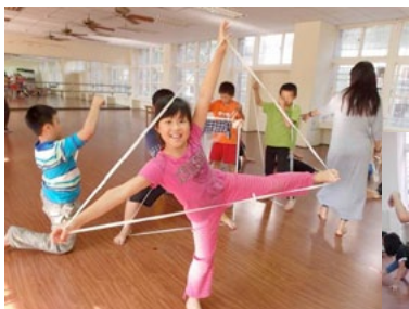
透過鬆緊帶，學生表演高、中、低水平的創作。