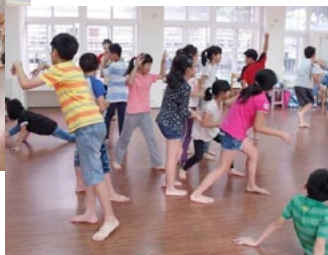
配合音樂，學生自行創作各水平的動作。