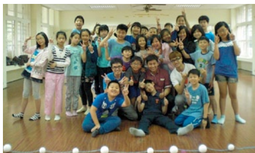
合照-小水滴遇見藝術家