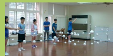
跳躍的水滴要旅行囉

在這套課程裡，老師和學生的高度一樣，師生間沒有明顯的界限，反而能在肢體的開展和創意的發想中，“玩”成一堂課。創造、想像、合作、同心協力……是孩子們“玩”出的心得。這樣的玩，很特別，也很有意義！孩子的笑聲是最美的音符，孩子的笑臉是最佳的註解，除了值得將之收藏以外，我更想與大家分享。