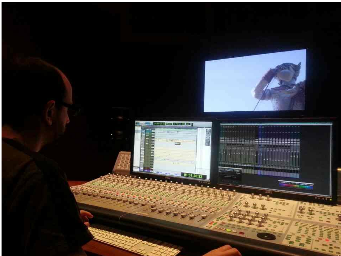
聲音剪輯室_法國剪接師正在為我的作品作聲音剪輯