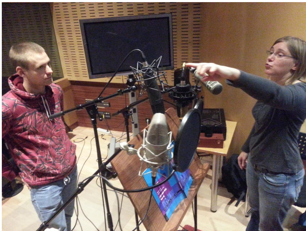
聲音工作坊介紹各式錄音器材