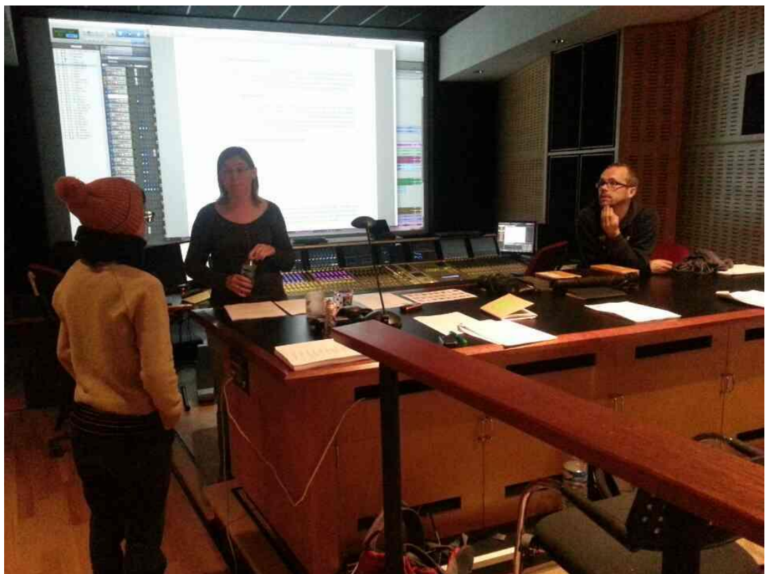
在杜比音效工作室的聲音工作坊