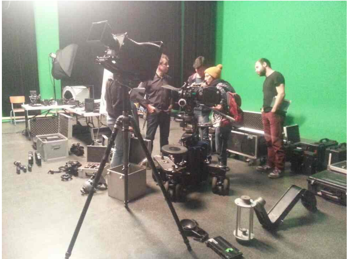
工作人員展示各式器材並說明使用方式