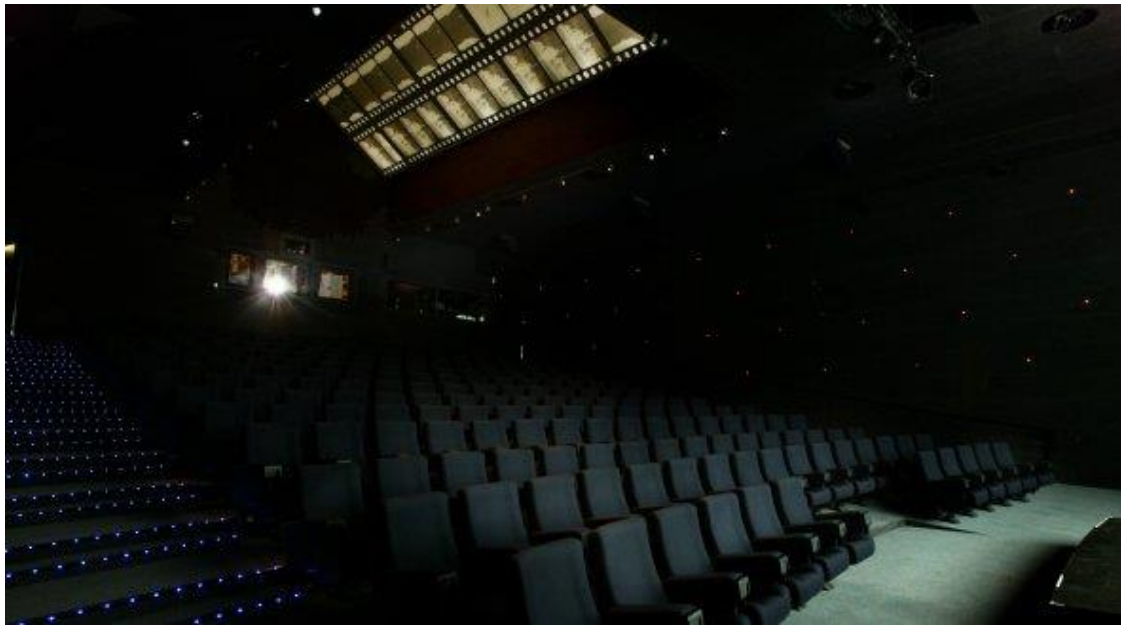
兩百人座的 35mm 電影院