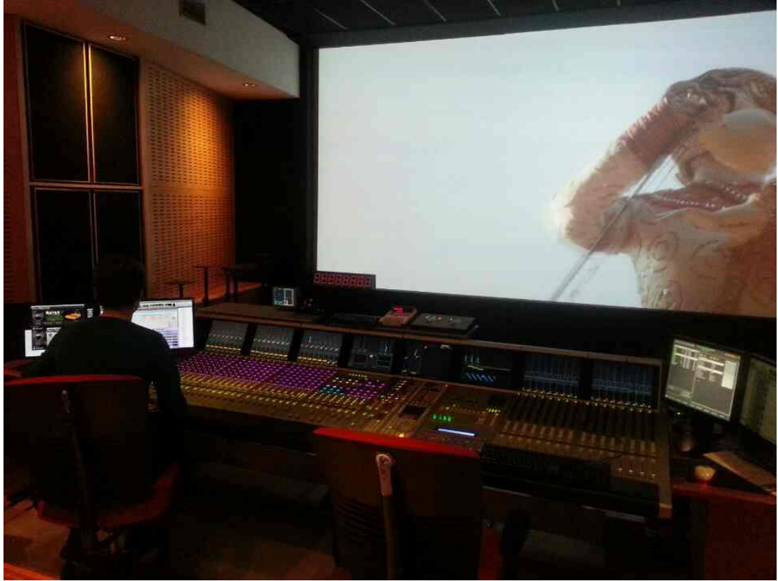
杜比工作室_正在做影片的聲音 MIX