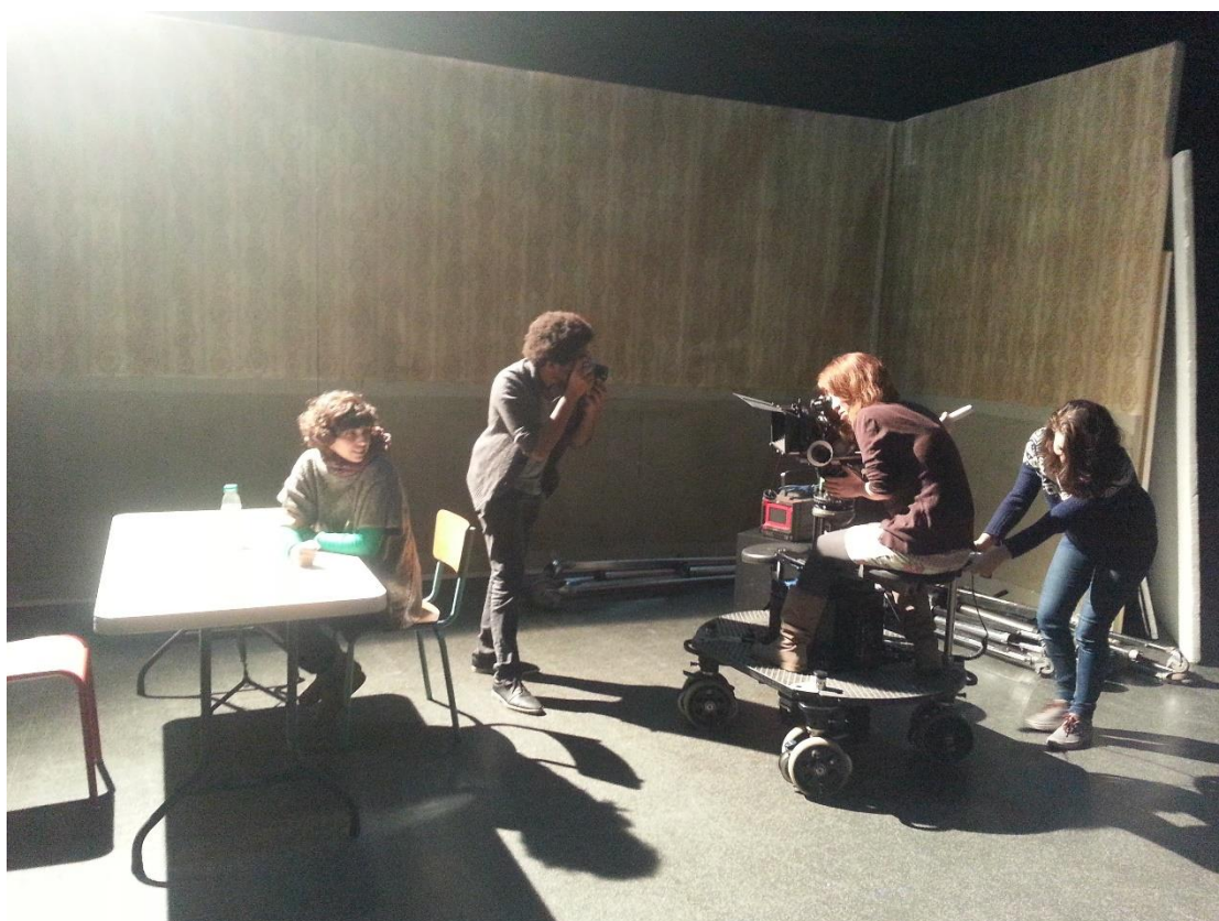
電影拍攝工作坊_實際搭景演練