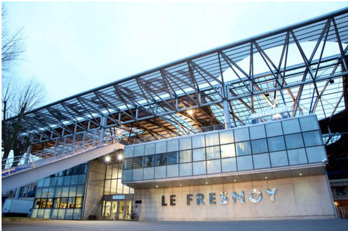
菲諾爾法國國立當代藝術工作室的外觀

1997 年菲諾爾法國國立當代藝術工作室在歐盟區域規劃發展署、法國文化部和北加萊省聯合協議框架下在法國北部城市圖爾寬（Tourcoing）落成，是歐洲最重要的當代視聽藝術創作中心和高等藝術研究中心。藝術中心不僅承擔大型當代藝術展覽、藝術傳播以及製作的任務同時也兼具著視聽科技研發和支持藝術家創作發展的職責。其前身為一座廢棄工業廠房，後由瑞士建築大師伯納德·屈米（Bernard Tschumi）在舊址重新設計而成。建築群佔地一萬六千平米，其中包含兩個電影院，一個音樂廳，一個展覽中心，三個攝影棚，多個圖書館，以及多個聲音，影像研究室，電影後期機房和藝術家工作室。同時，工作室擁有世界上最先進的影像和聲音設備器材。藝術中心由法國前任文化部部長，前任龐畢度藝術中心館長多米尼克·博索（Dominique Bozo）為機構角色定義為：「視聽高科技的包浩斯」。