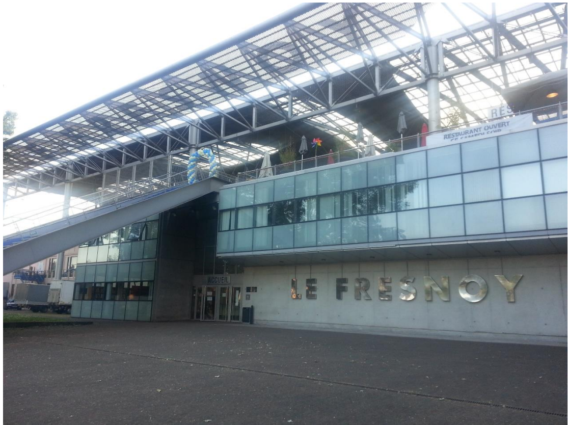
菲諾爾法國國立當代藝術工作室外觀