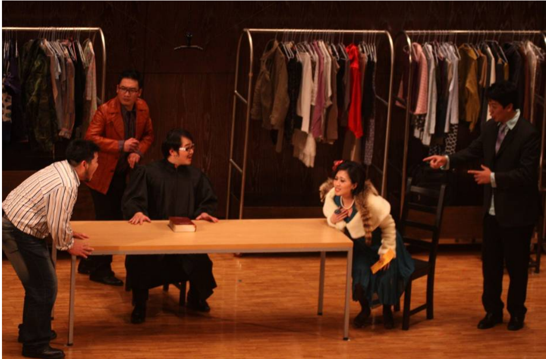
《第三幕：認親六重唱，費加洛被仇家們輪番砲轟，要他履行合約》