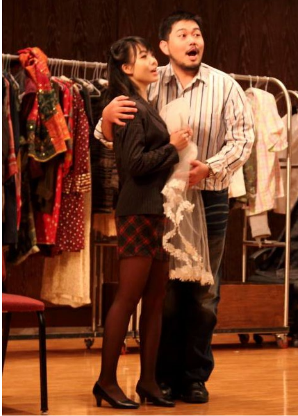
《第一幕：費加洛與蘇珊娜的二重唱》