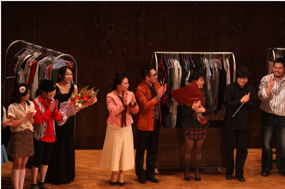
《劇終，指揮與歌手們接受觀眾熱烈的掌聲》