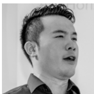
Conte di Luna 盧納伯爵