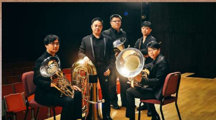
曼斯特低音銅管四重奏