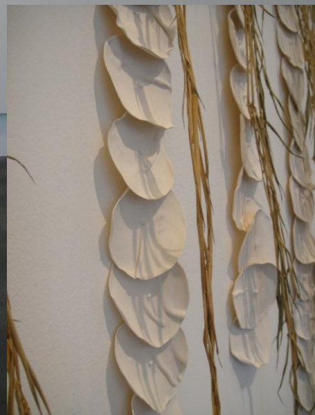
竹裡的陶 瓷片, 竹, 針, 魚線 720x100x5 cm, 2010