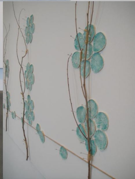
尤加利的故鄉 瓷片, 尤加利樹枝, 麻線, 針 600x100x5 cm, 2010