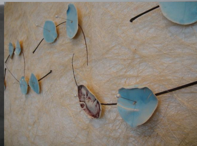
鳳凰木的家 瓷片, 鳳凰木葉幹, 苧麻紙, 針 720x90x5cm, 2010