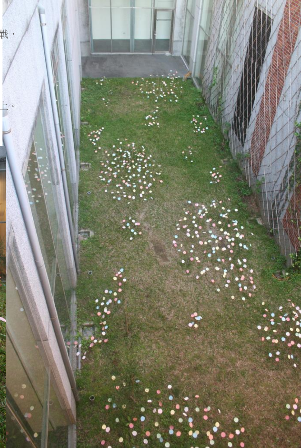
戶外裝置 自然系列2012-5 化妝土, 竹 26x6m, 6x6m