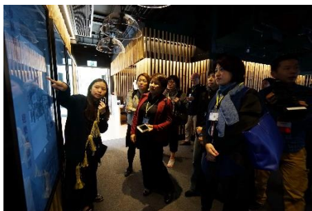
多媒體互動式說明