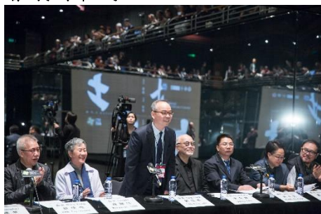
香港特區民政事務局局长劉江華 開幕致詞