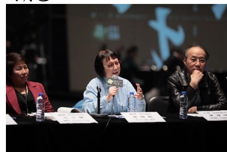
辜懷群－未來二十年展望總結