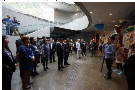
以粵劇為主的高山劇場