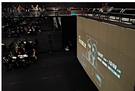
台北年度影片獲得極高評價