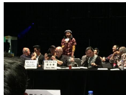
台灣戲曲學院學生發表交流感想