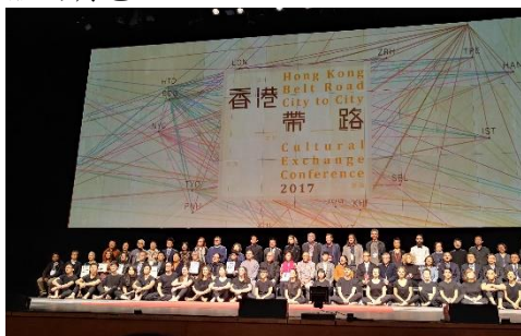
香港一帶一路開幕式