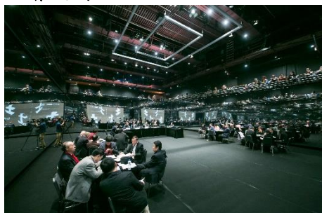
會議在香港文化中心劇場舉辦