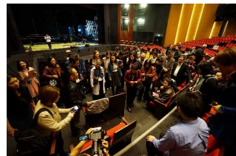
劇場座椅可以拆卸以利輪椅觀眾