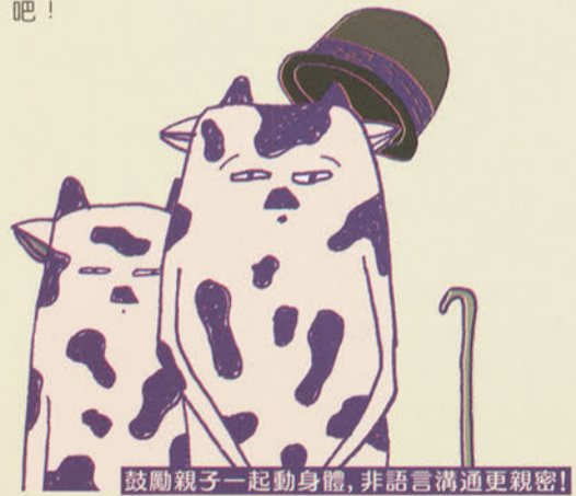
鼓勵親子一起動身體，非語言溝通更親密！

從肢體的塑造、互動與想像中，建立親子之間的非語言溝通方式，在笑與動中，拉近身體距離，展現語言未能表述的世界。2015年尚德老師來澳帶了一個以孩子為主的默劇工作坊，孩子到現在還記得「默默」，這次帶爸媽來一起「默默」吧！