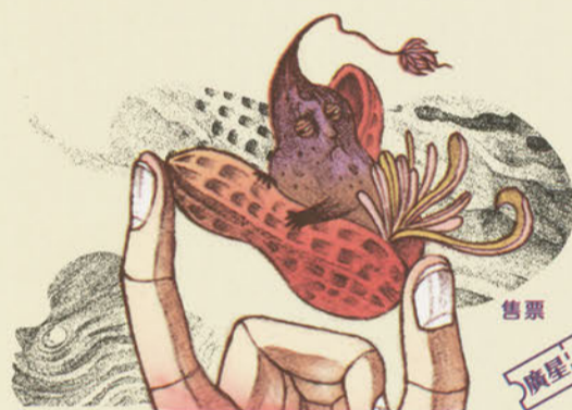
《叩！叩！死神》插畫設計：Summerise

「死神」不可怕嗎？這位小朋友為什麼要尋找死神的幫助？台灣野孩子肢體劇場改編自歐洲童話《核桃裏的死神》，以別出心裁的肢體默劇與故事展演跟親子觀眾積極面對生命有始有終，共同探討生命最重要的一課。溫柔、安靜，又充滿力量。