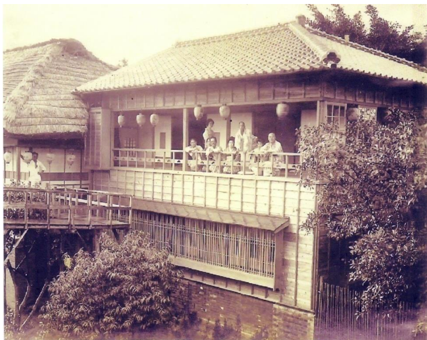
圖 2-2 於紀州庵消費客人之合照，左方可見圖 2-1 中兩層樓茅草頂之建築，右方為之後增建的兩層樓木造瓦頂建築，建造年代不明。