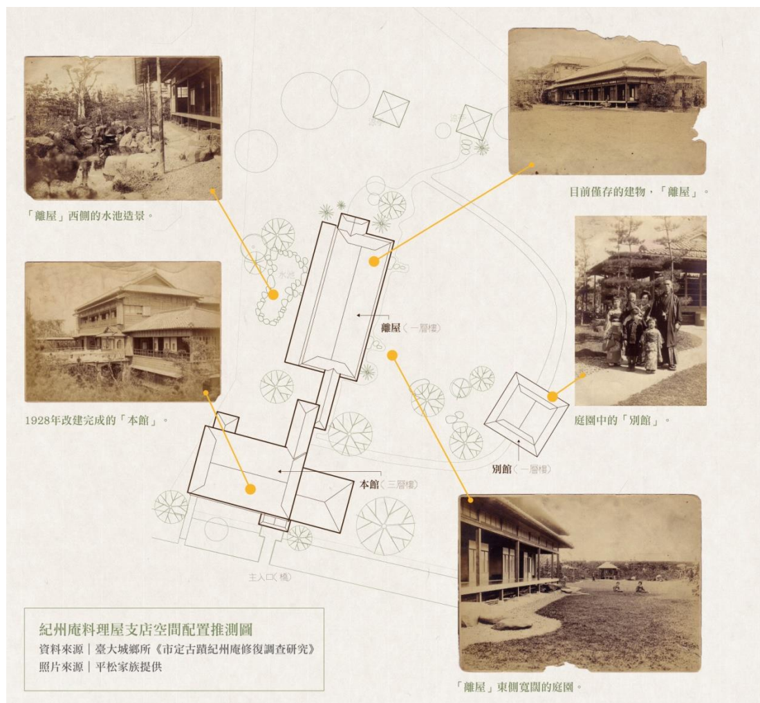
圖 2-7 紀州庵料理屋支店空間配置推測圖