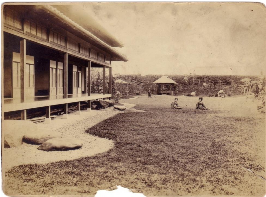
圖 2-5 離屋東側之日式庭園，後方隱約可見涼亭。

離屋東側除日式庭園外，另興建招待貴賓之別館，別館大約 20-30 疊榻榻米大小，因資料不足，僅能從老照片中見其部分外觀，難以確認其建築形式。