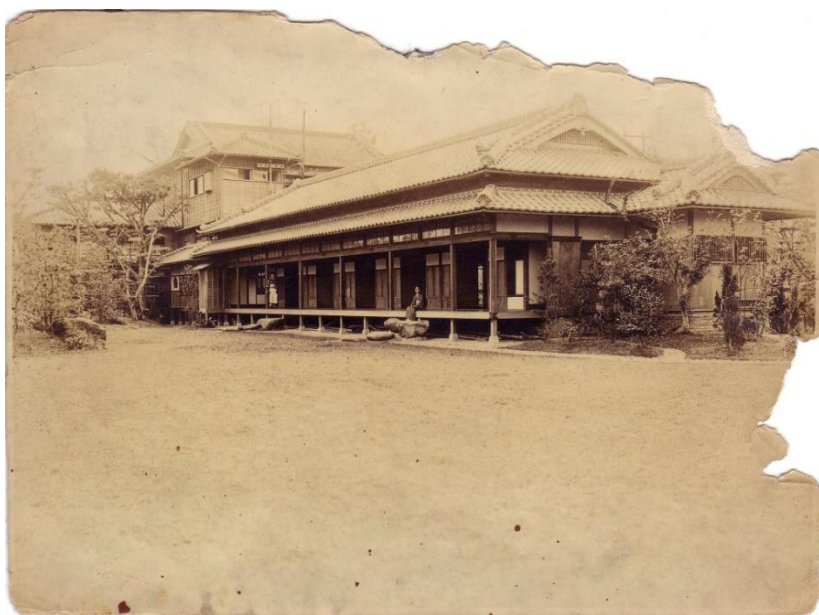
圖 2-4 離屋外觀

本館後方增建「離屋」，為招待團體客人之「廣間」，內部空間共六十疊榻榻米大小，客人由本館後方連通離屋之通道進入，西側為水池假山造景，東側則為日式庭園造景。