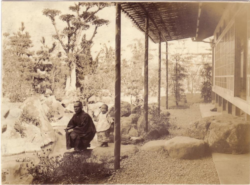
圖 2-5 離屋西側之水池與假山造景。