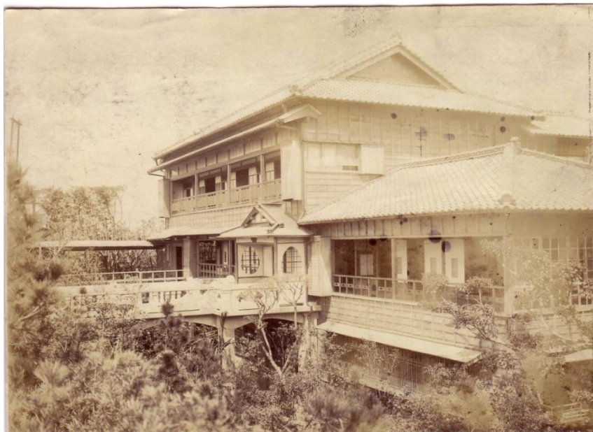
圖 2-3 改建後之紀州庵支店本館建築

隨著新店溪畔遊憩之風日盛，平松德松逐漸將經營重心移轉到紀州庵支店，本店委由長子泰藏、三子重雄經營，平松德松則與二子榮、四子勝治經營紀州庵支店。1927 至 28 年間，紀州庵支店擴建，由平松德松岳家之的場雄吉興建施工，原有的茅草頂二層樓建築物「本館」改建為瓦頂三層樓木造建築，緊依右側的兩層樓建築（見圖 2-3）。