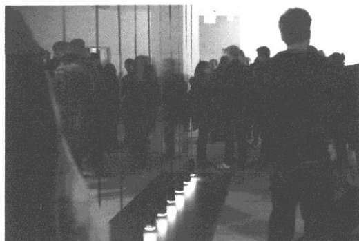
圖說：圖為 IDOLONSTUDIO 於柏林所策畫的台灣當代藝術展覽《城市閃爍 III》