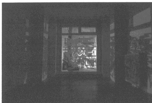
圖說：圖為 IDOLONSTUDIO 於柏林所策畫的台灣當代藝術展覽，邀請藝術家吳耿禎進行大型裝置創作