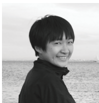
動畫 Animation Design / 魏閔廷 Ho-Ting Wei

郭晉銓書法行草以東晉王羲之、唐代孫過庭為法；楷書以唐代虞世南、元代趙孟頫為底；篆隸以東漢史晨碑、清代鄧石如為範，師承施隆民教授。目前為臺北市立大學中國語文學系專任教師，長期擔任校內、外書法評審委員，著作包括《沉鬱頓挫——臺靜農書藝境界》、《從王羲之到王靜芝——帖學傳統中的典範書學體系》等書法論著，另外有多篇書法研究論文發表於各大學術期刊與研討會。書法展覽包括十餘次聯展與兩次個展，並曾為電影「滿月酒」題字。