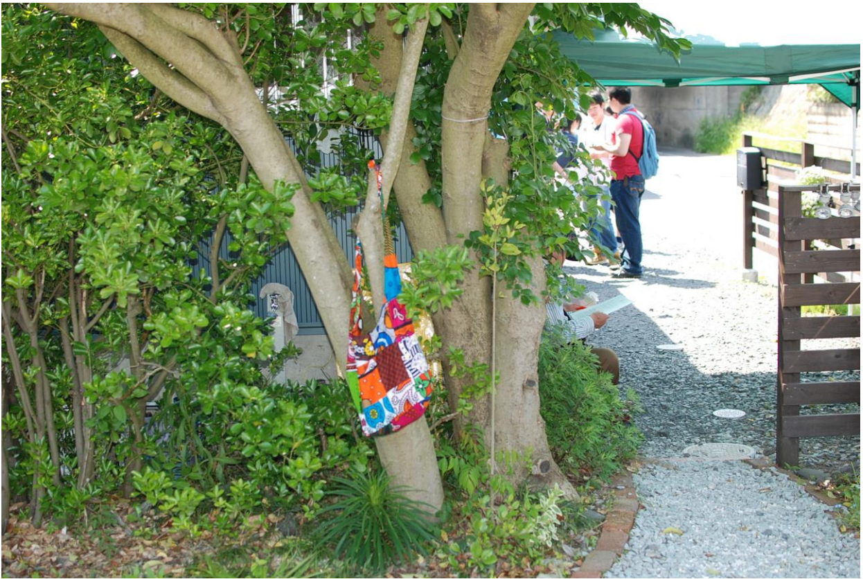
(觀眾準備入場，另一個角度)