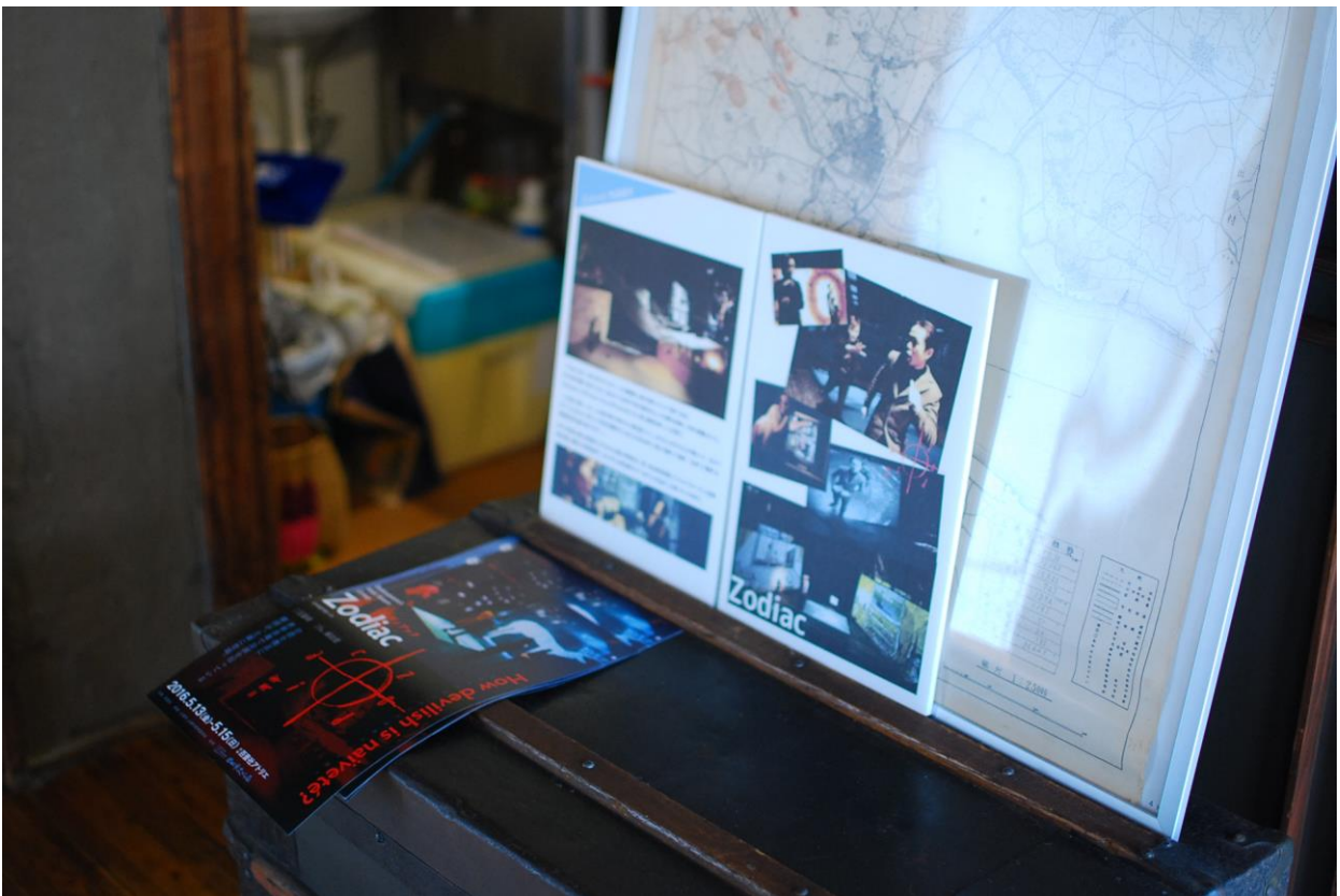
(社內演出相關文宣擺放)