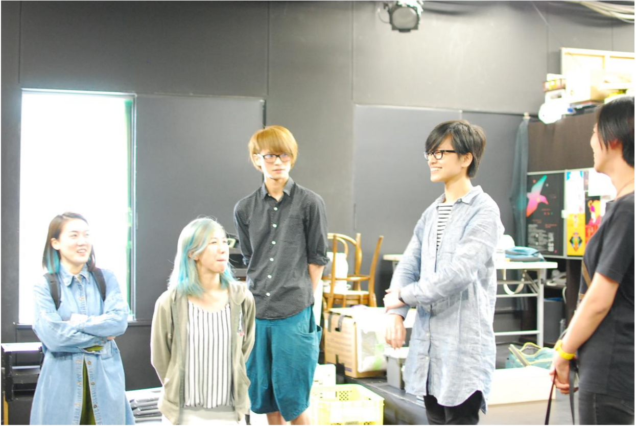
(與百景社成員初碰面)