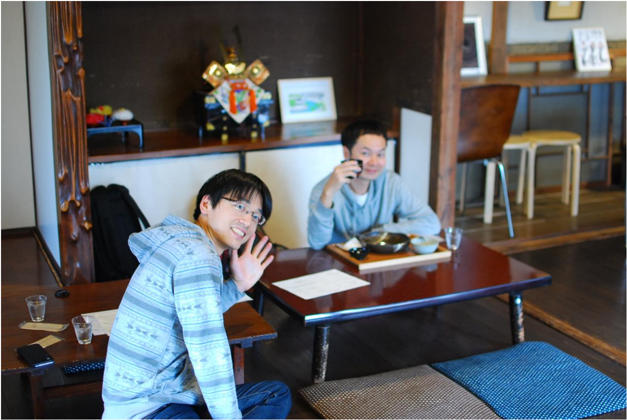
(工作之餘的休憩及用餐處)