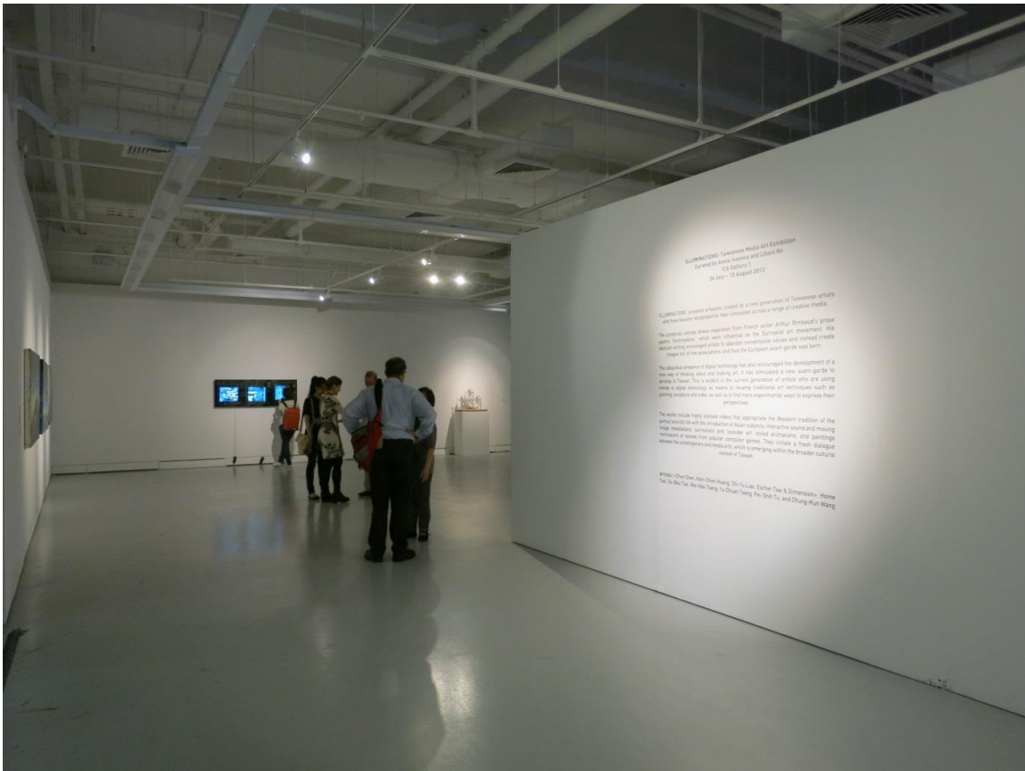
展場全圖-1，規劃開放空間。