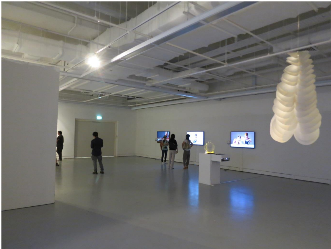
展場全圖-5，展出杜珮詩作品：可見的敘事 The Visible Story