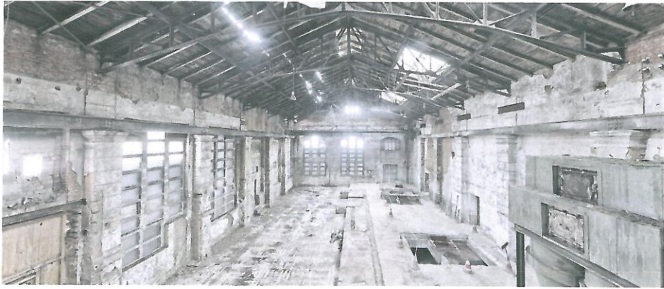
(藝術中心內部(整修前))