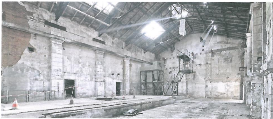
(藝術中心內部 (整修前))