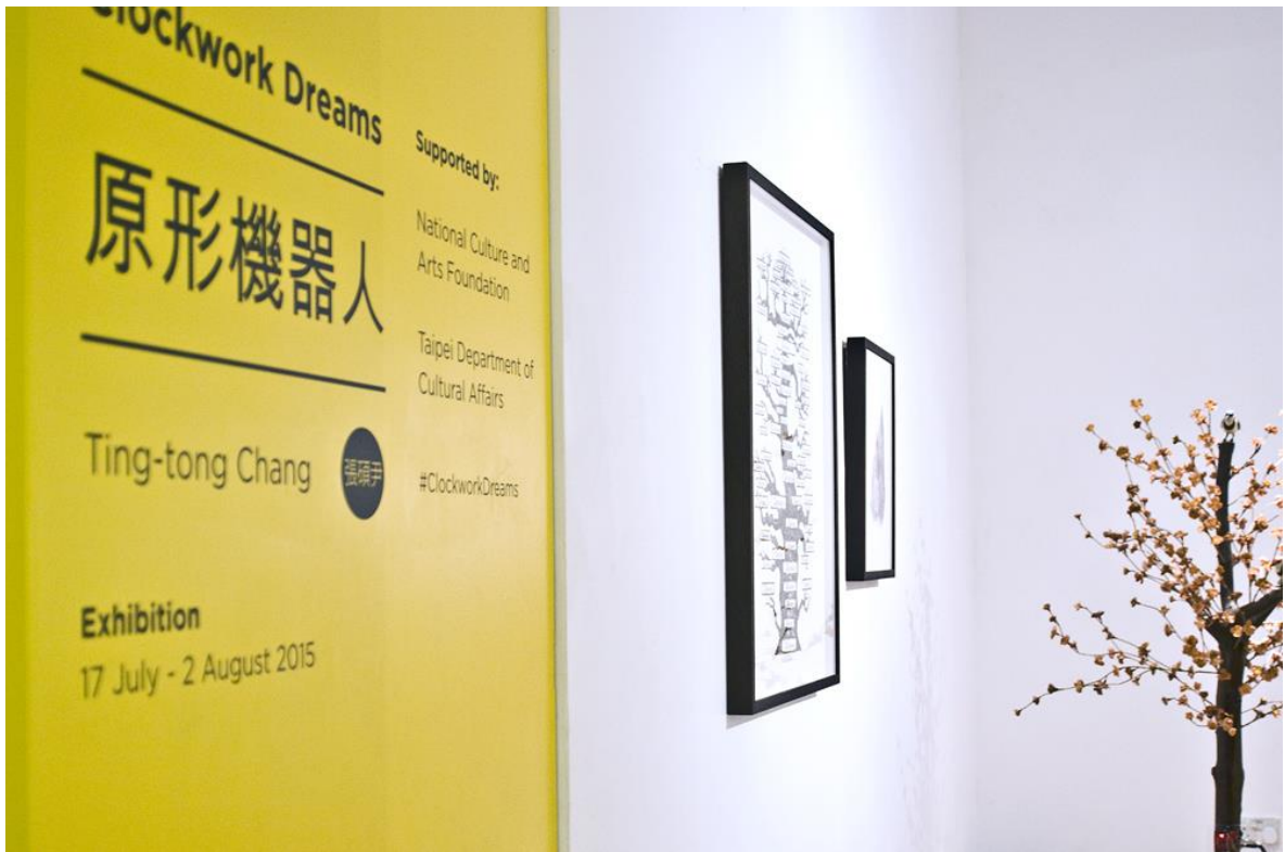
(展覽入口卡典西德說明)