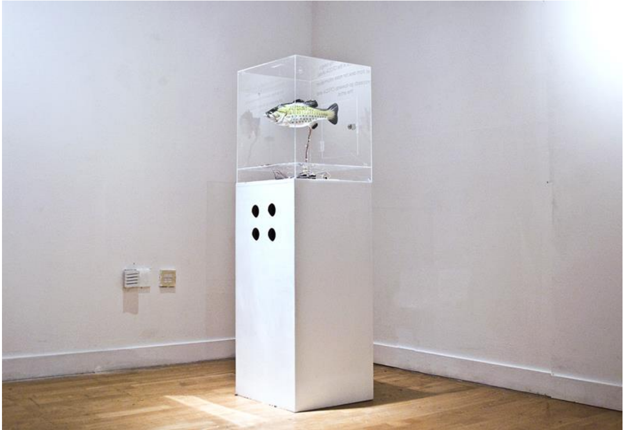
(裝置作品 So Far So Good)