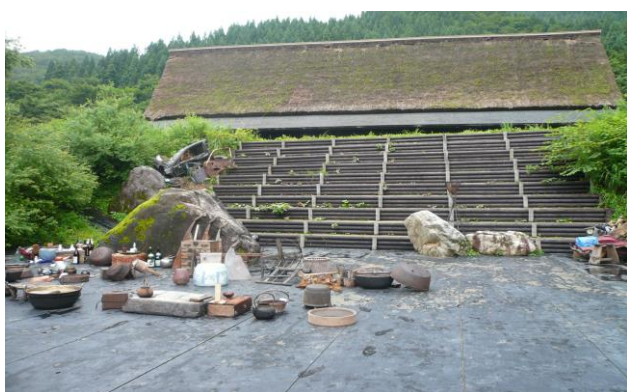
岩舞台：約 150 席