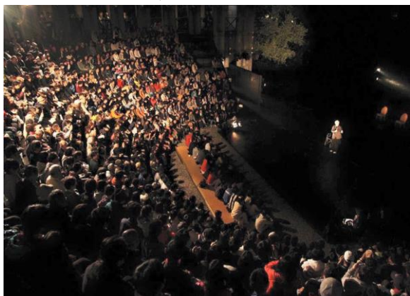
野外劇場：約 800 席