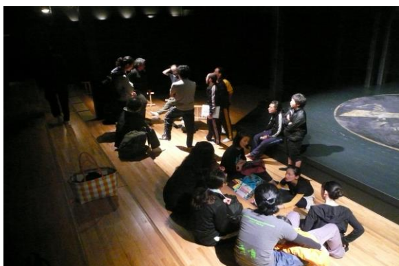
舊利賀山房劇場：約 150 席