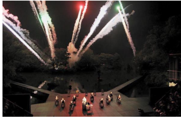
野外劇場演出的煙火