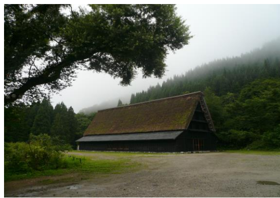
新利賀山房劇場：約 200 席