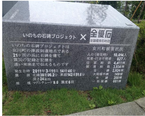
女川町海嘯被害紀念石碑