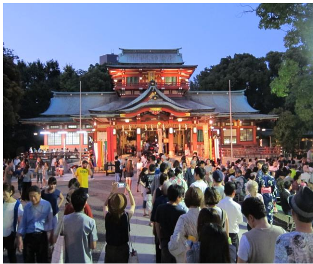
祭典的戶外能劇演出