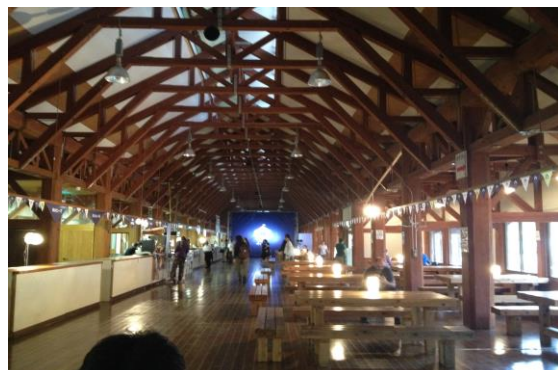
食堂：約 100 席