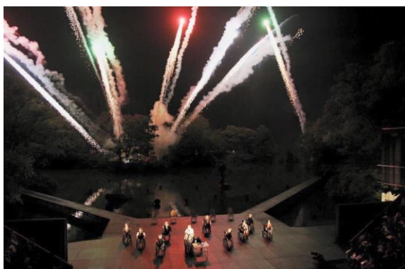
野外劇場演出的煙火