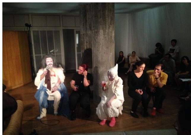
慶應大學主辦的海外舞蹈家演出