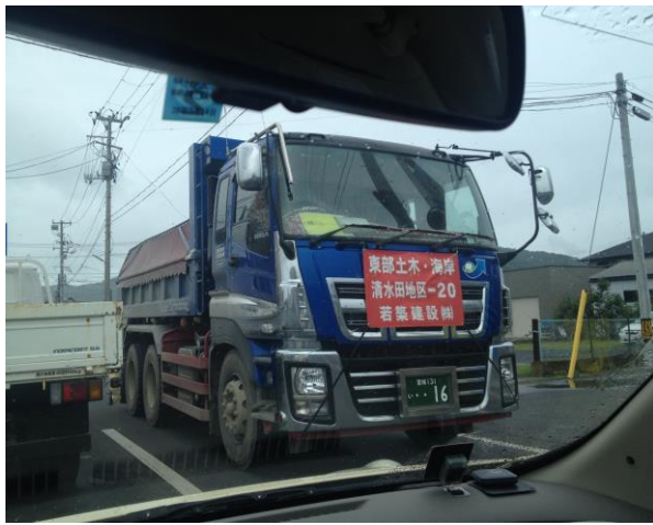
不停穿梭的除污工程車