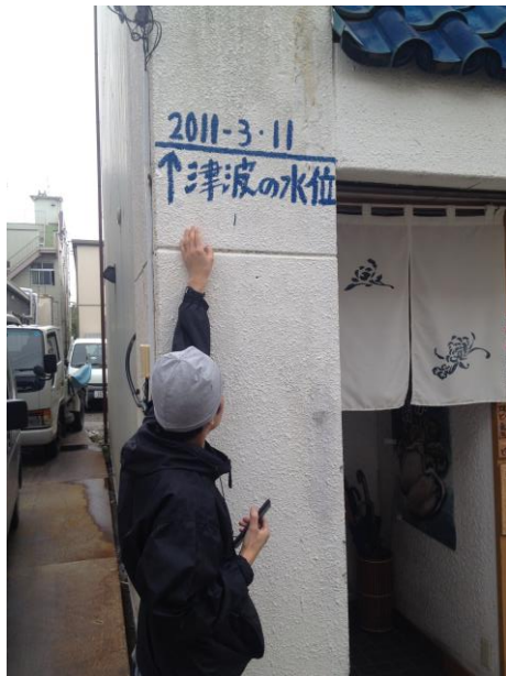
海嘯時的淹水高度