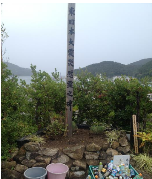
東北大震災慰靈碑