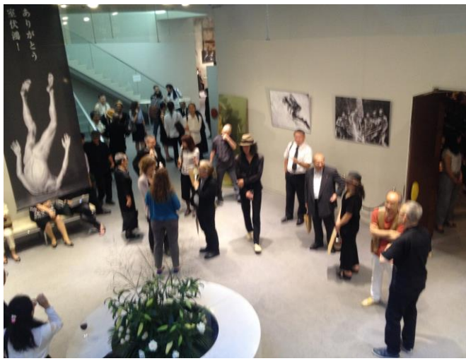
舞踏大師 室伏鴻告別會