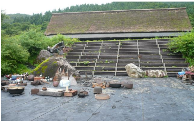
岩舞台：約 150 席