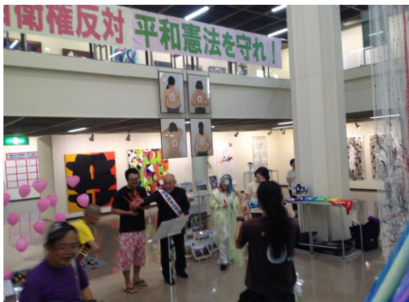
神奈川県民中心 反戦展示会場