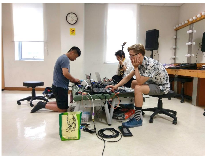
▲ Practice Room