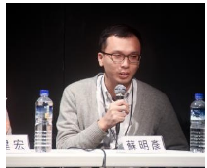
專題講座 台灣觀點 II：台灣日記電影導演論壇