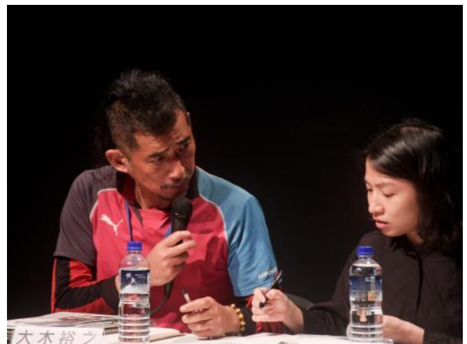
專題講座 日本日記電影專題：私小說、私電影