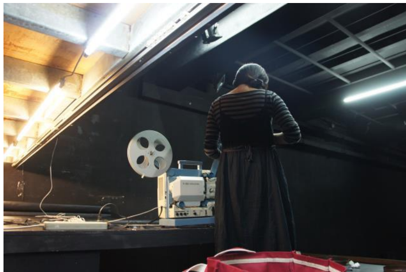
台灣導演作品 16 釐米膠捲放映