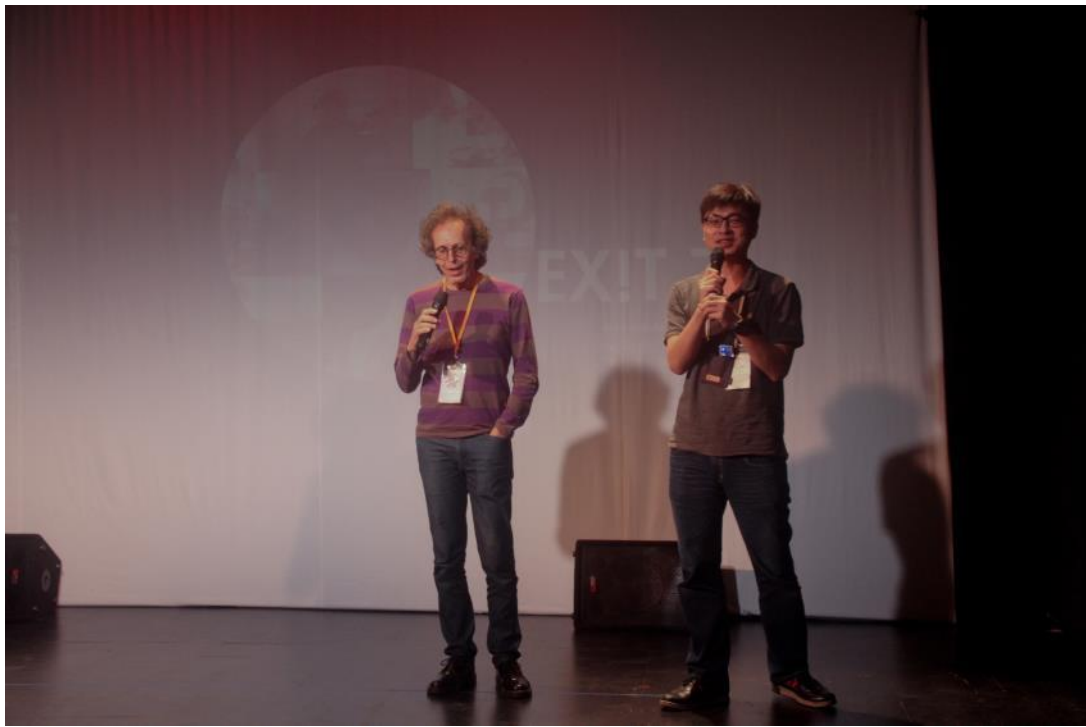
開幕活動（酒會、徵件自由映、法國導演顏博飛致詞）