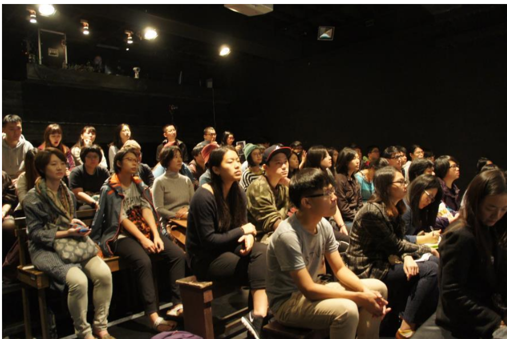
專題講座 台灣觀點 I 從劉吶鷗到莊靈