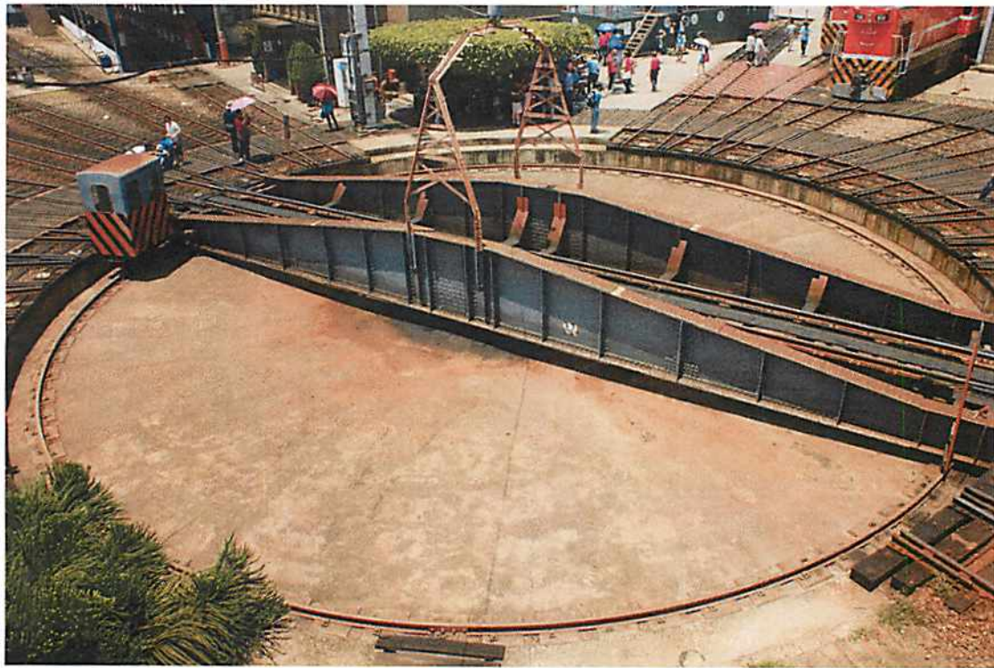
圖說 27 彰化歷史巡禮：彰化火車站之 3。