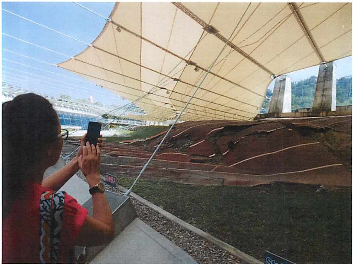
圖說 22 彰化歷史巡禮：921 地震博物館之 2