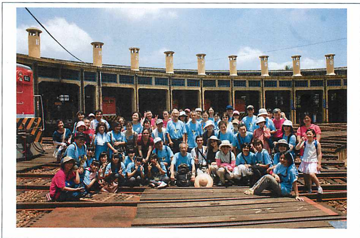
圖說 26 彰化歷史巡禮：彰化火車站之 2。