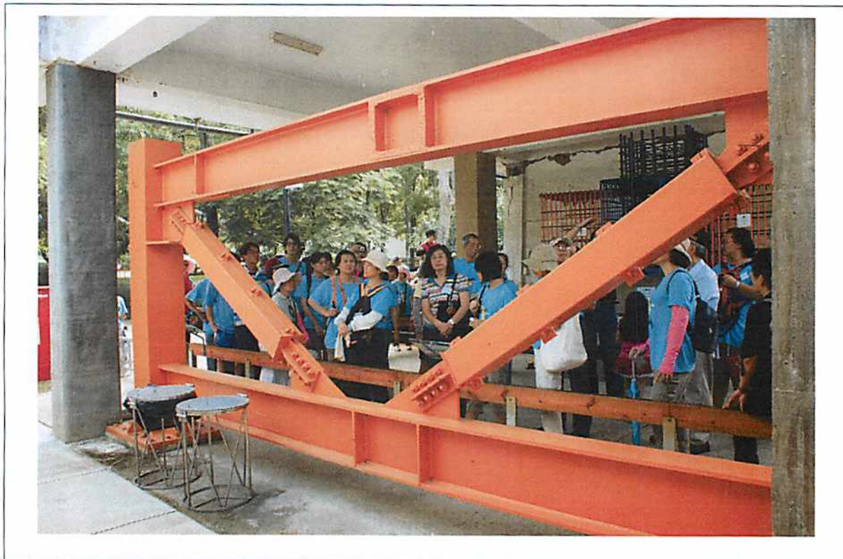
圖說 23 彰化歷史巡禮：921 地震博物館之 3