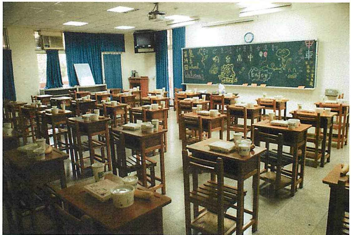
圖說 08 晚餐前，工作人員貼心的先把便當餐盒和水果放在學員教室桌上。