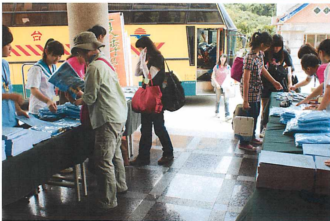
圖說 02 學員報到：學員下車後，分兩邊依照自己組別報到領取資料。