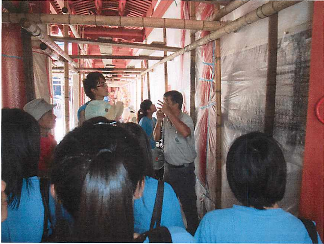
圖說 29 彰化歷史巡禮：元清觀。