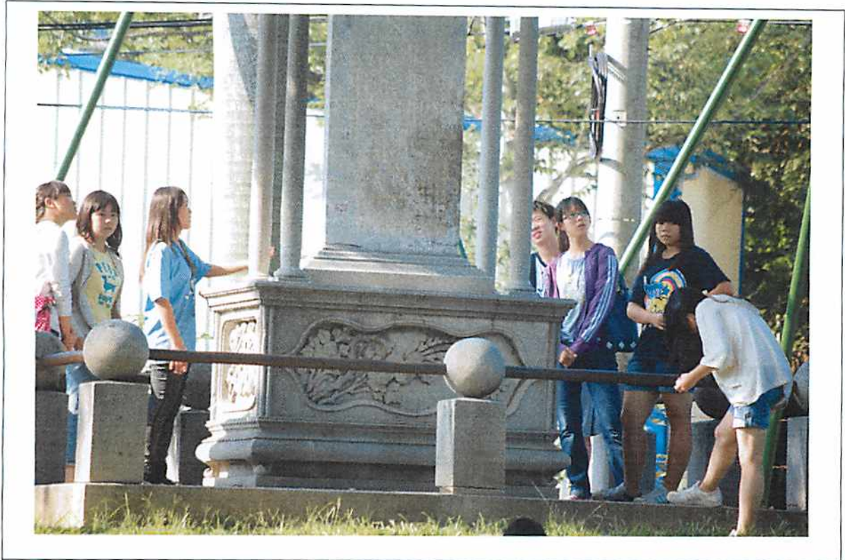
圖說 17 萊園巡禮：櫟社二十年題名碑。