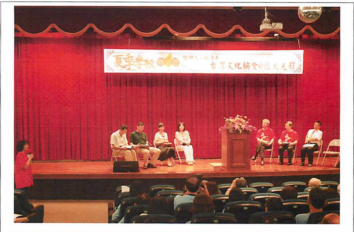
圖說 04 始業式：除本會副董事長、秘書長外，另明台高中董事長、校長、朝陽大學副校長等貴賓親臨始業式。