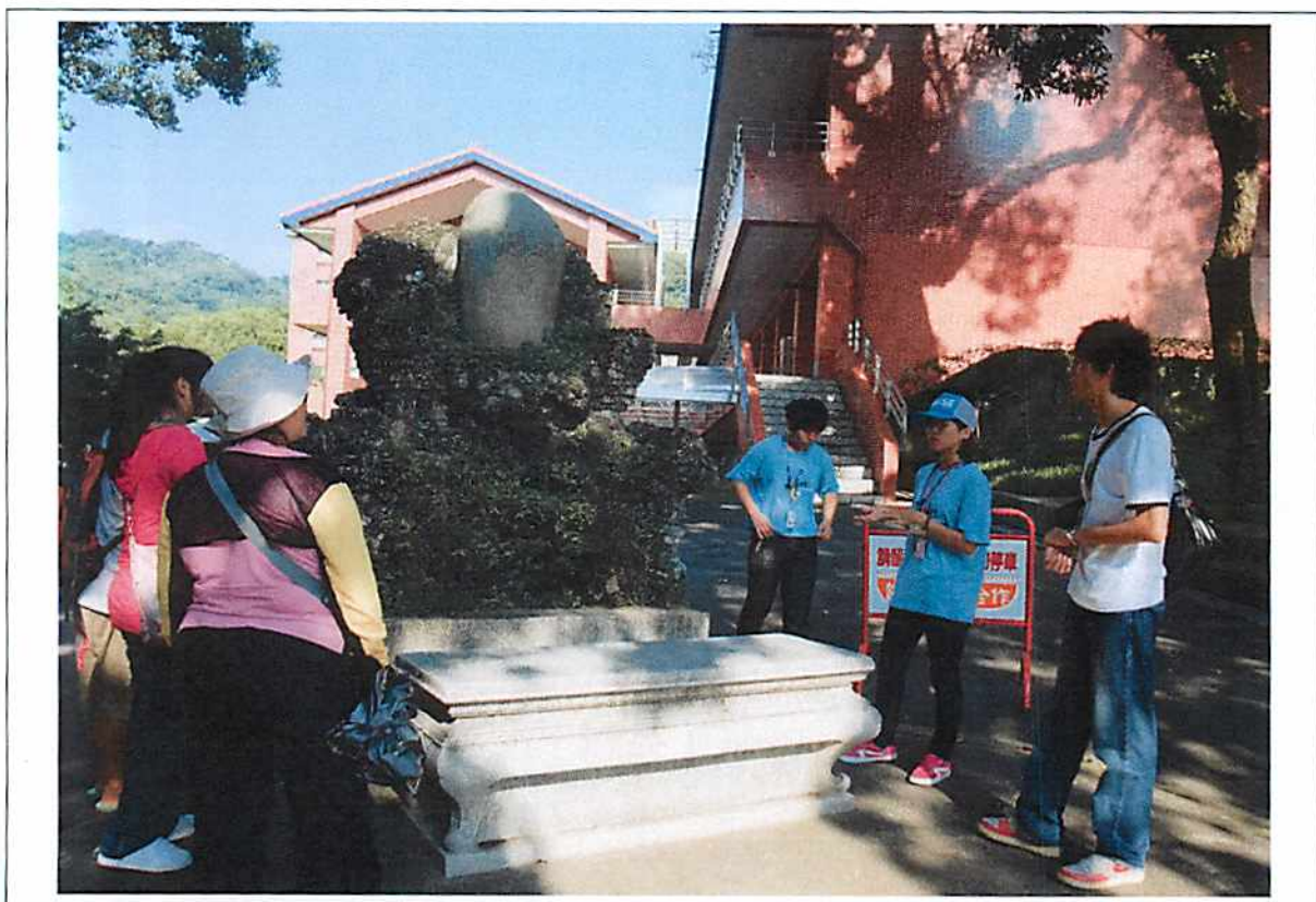
圖說 16 萊園巡禮：石頭公