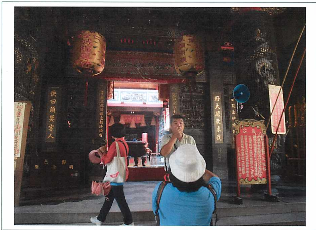
圖說 31 彰化歷史巡禮：城隍廟。