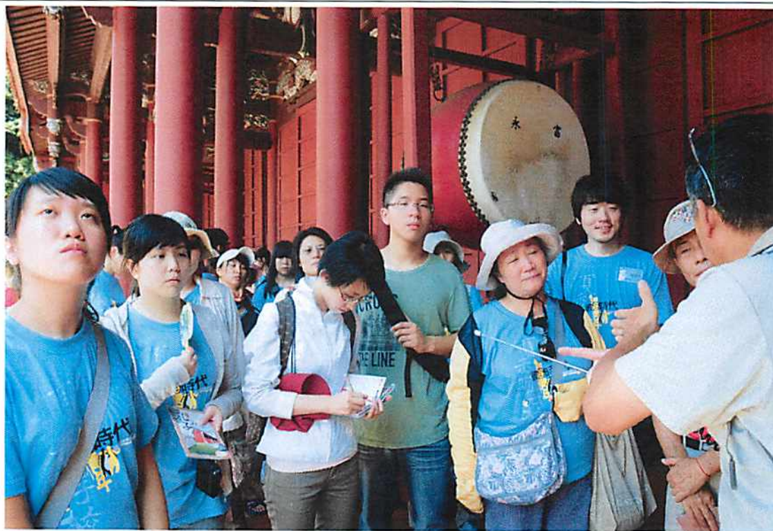
圖說 28 彰化歷史巡禮：彰化孔廟。