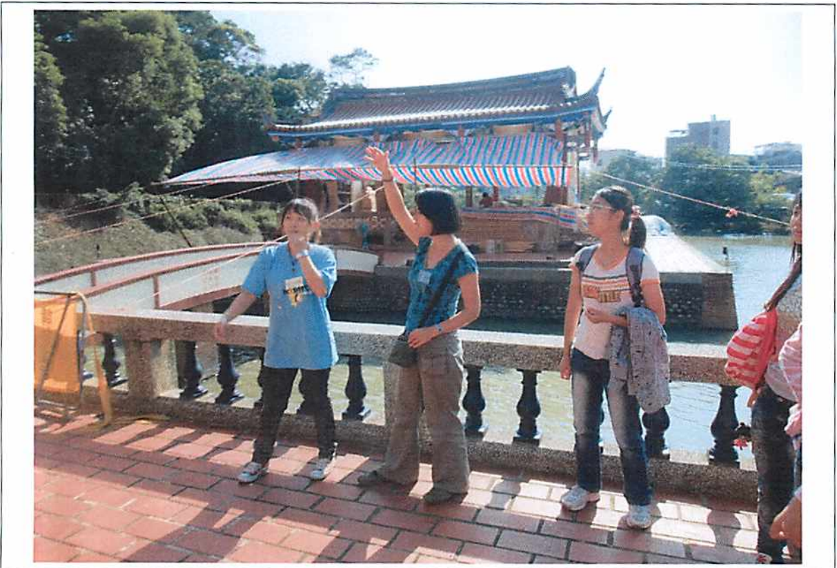
圖說 14 萊園巡禮：飛觴醉月亭、虹橋、荔枝島和小習池。