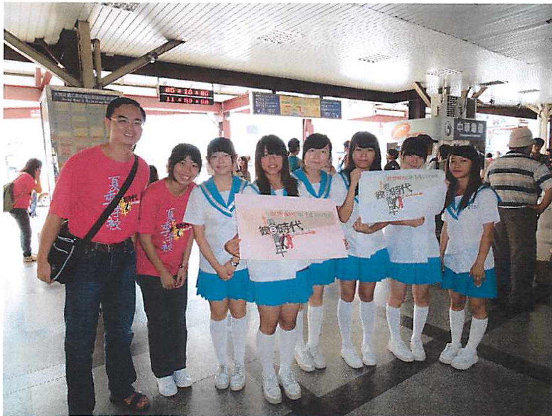
圖說 01 迎接學員：工作人員在台中火車站接送學員搭專車回明台高中報到。