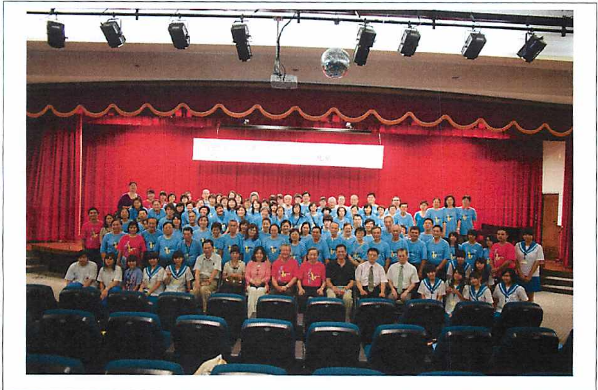
圖說 05 團體照：始業式結束後，全體學員與來賓合影留念，作為研習證書上的照片。