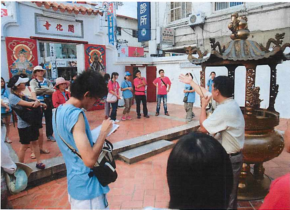
圖說 30 彰化歷史巡禮：開化寺。