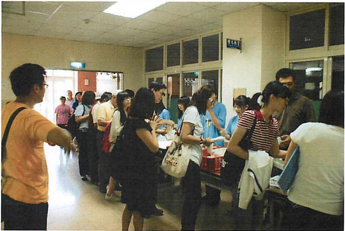
圖說 10 第二天早餐時間，學員井然有序的排隊領取早餐。