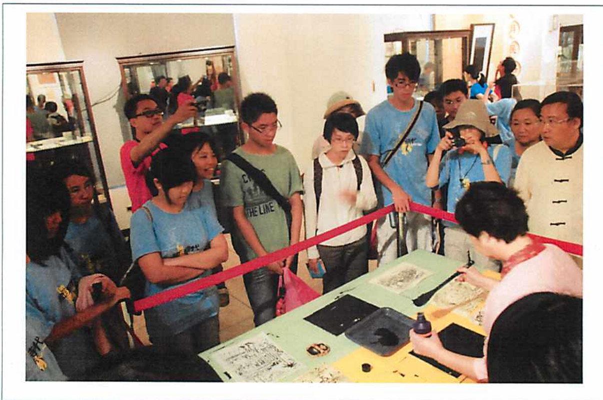
圖說 32 彰化歷史巡禮：古月文物館。