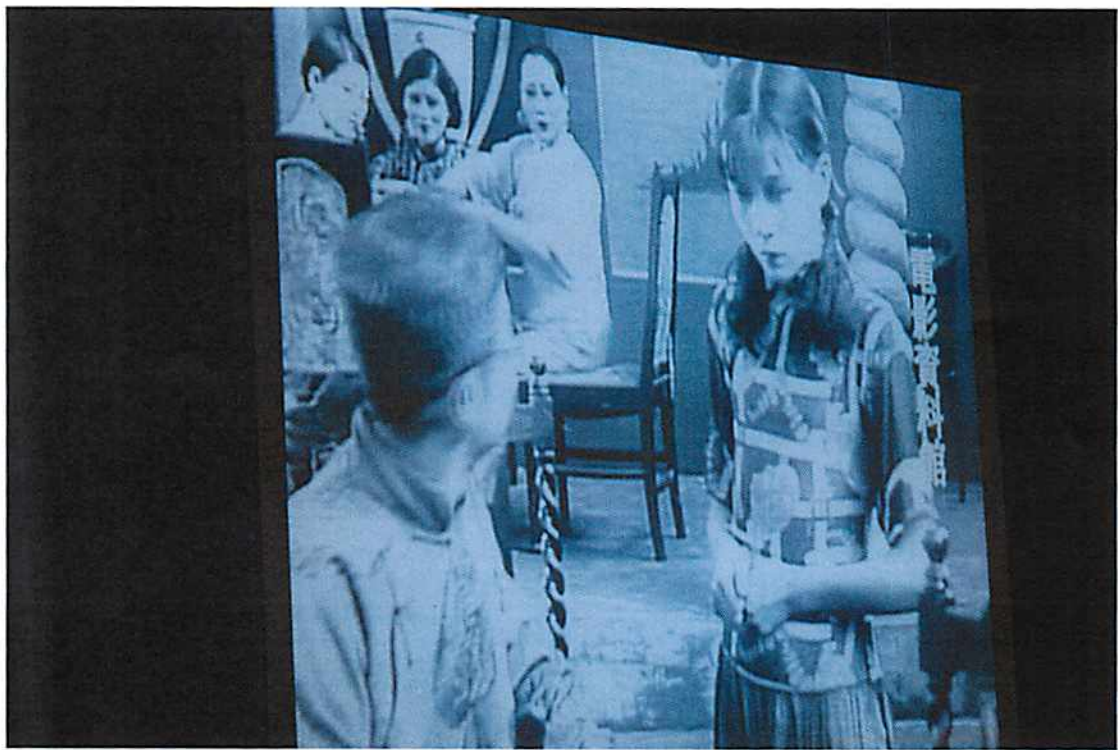
圖說 20 由三 0 年代阮玲玉主演的『戀愛與義務』默片欣賞