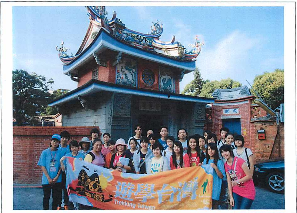
圖說 18 霧峰林家花園巡禮：頂厝景薰樓遊學台灣學員合影留念