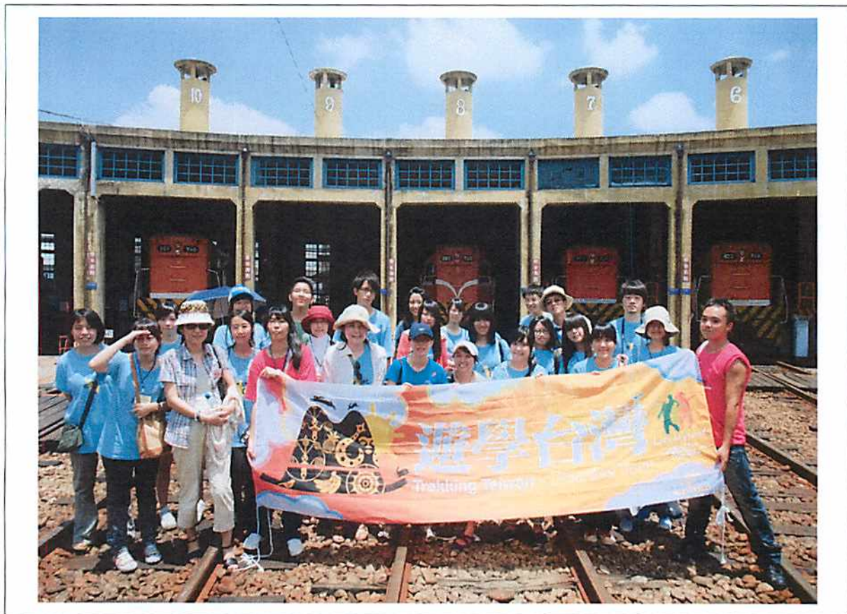
圖說 25 彰化歷史巡禮：彰化火車站之 1。