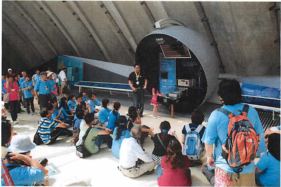
圖說 21 彰化歷史巡禮：921 地震博物館之 1