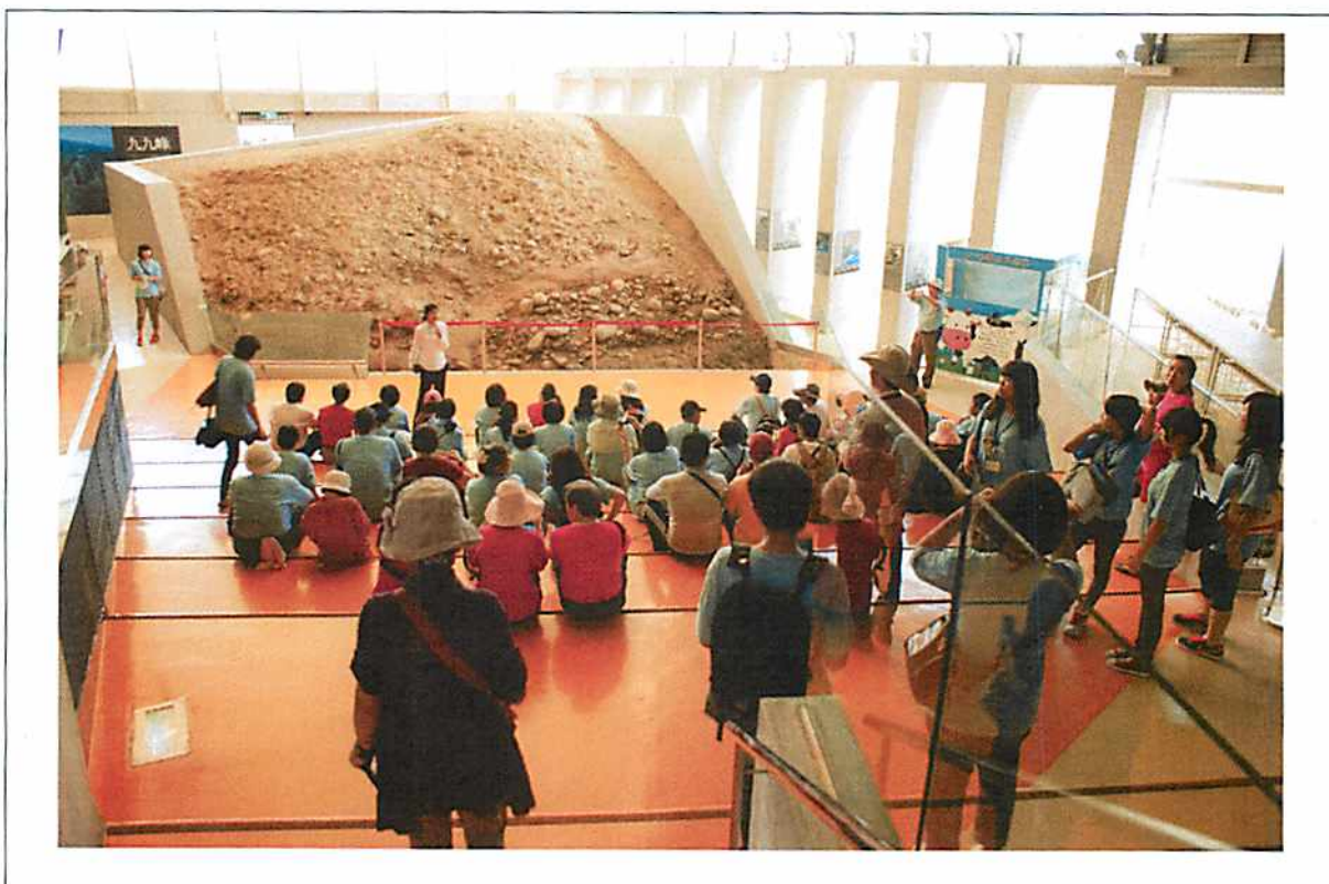
圖說 24 彰化歷史巡禮：921 地震博物館之 4